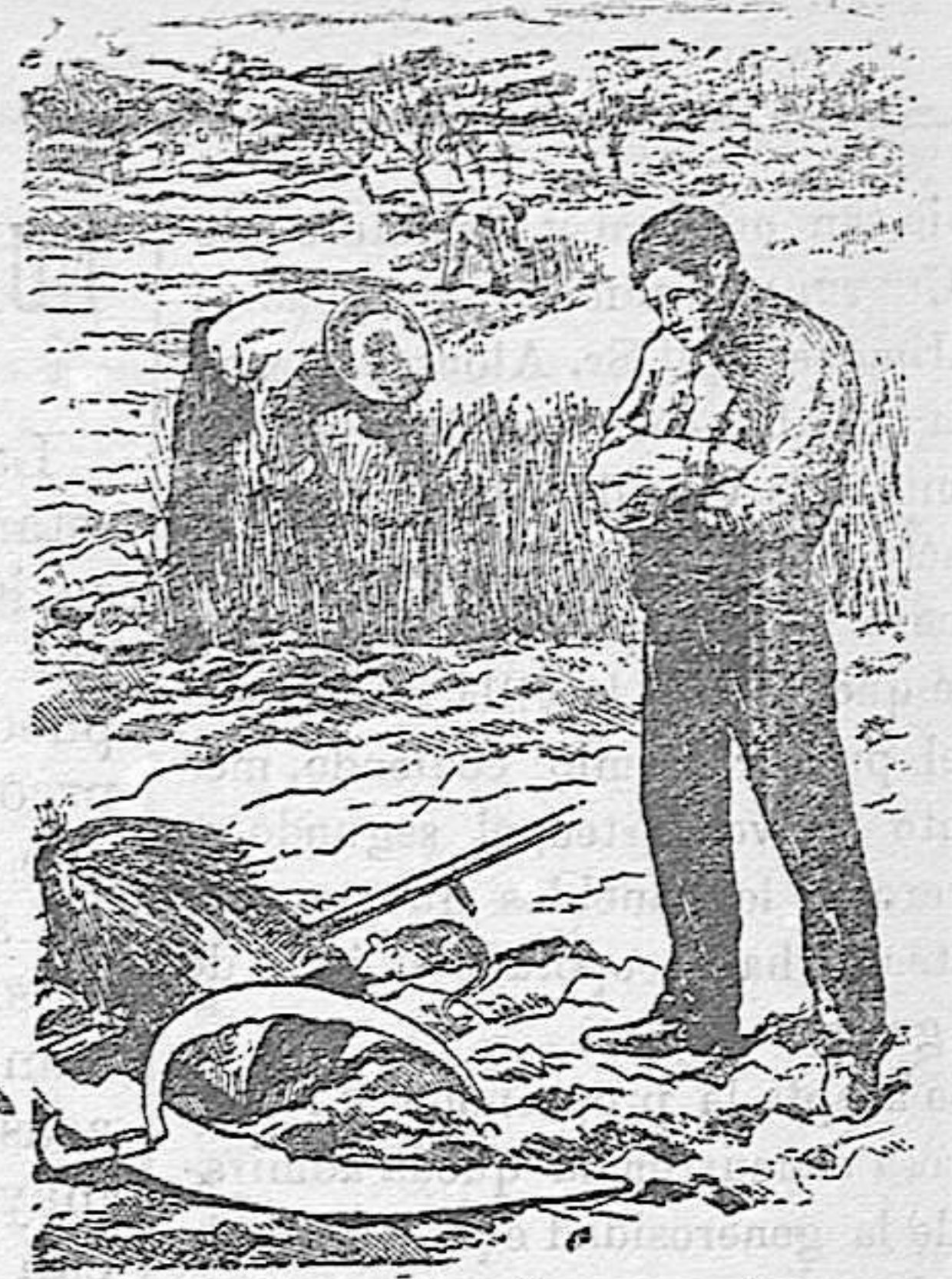
Agricultor rutinario que no lee