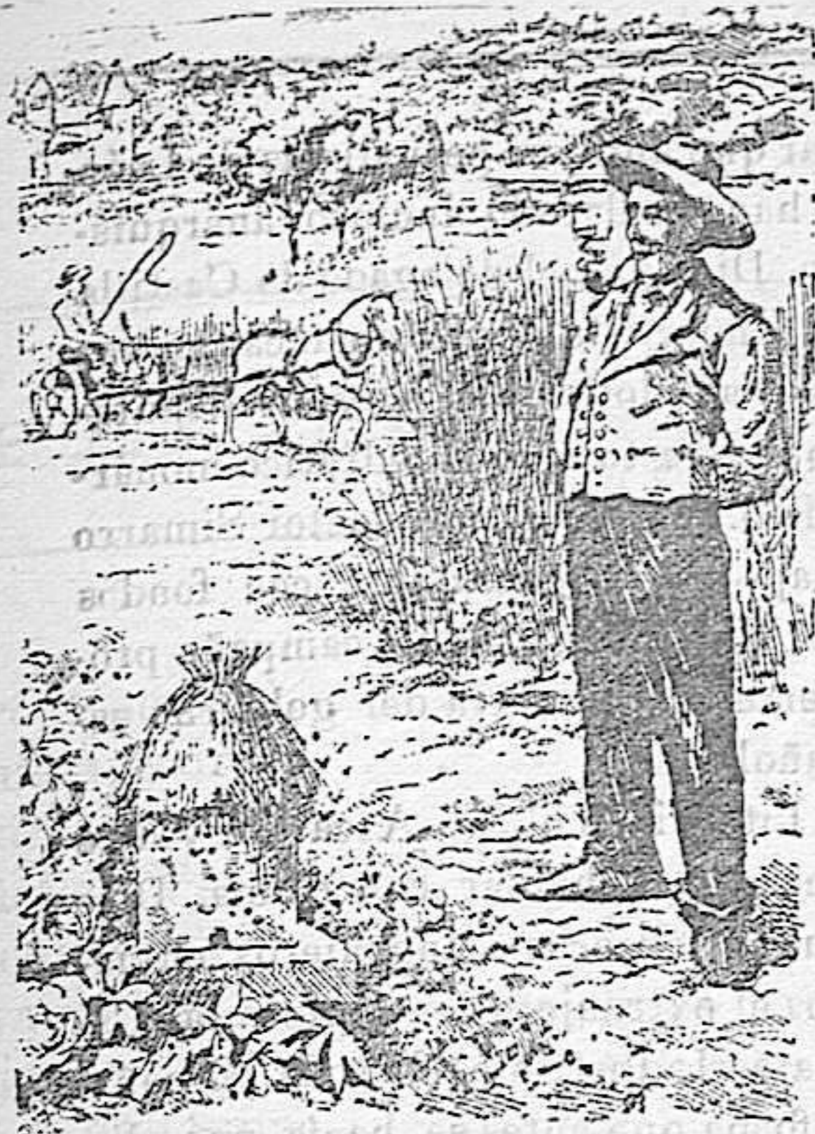
Agricultor moderno que se instruye