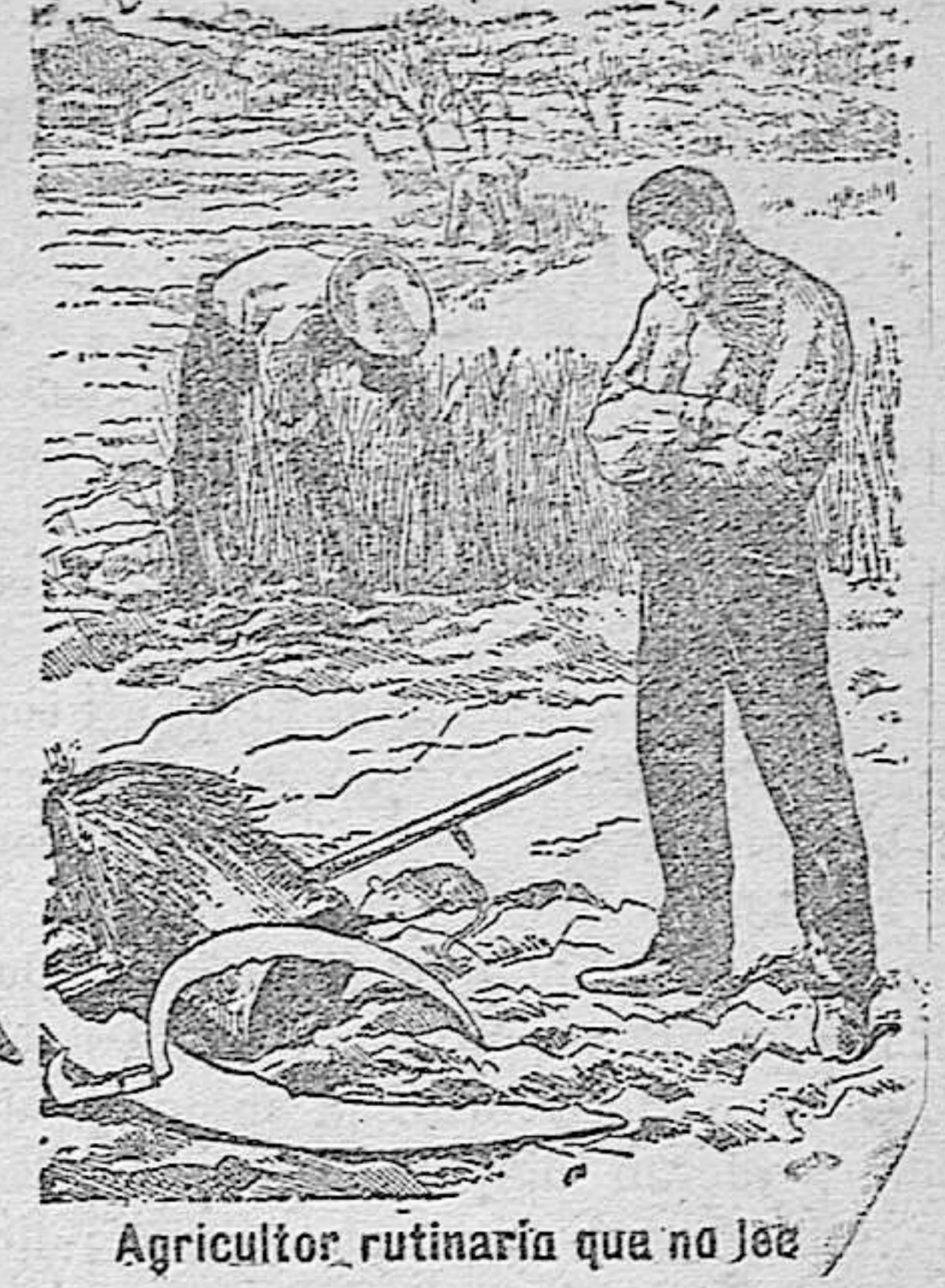
Agricultor rutinaria que no lee