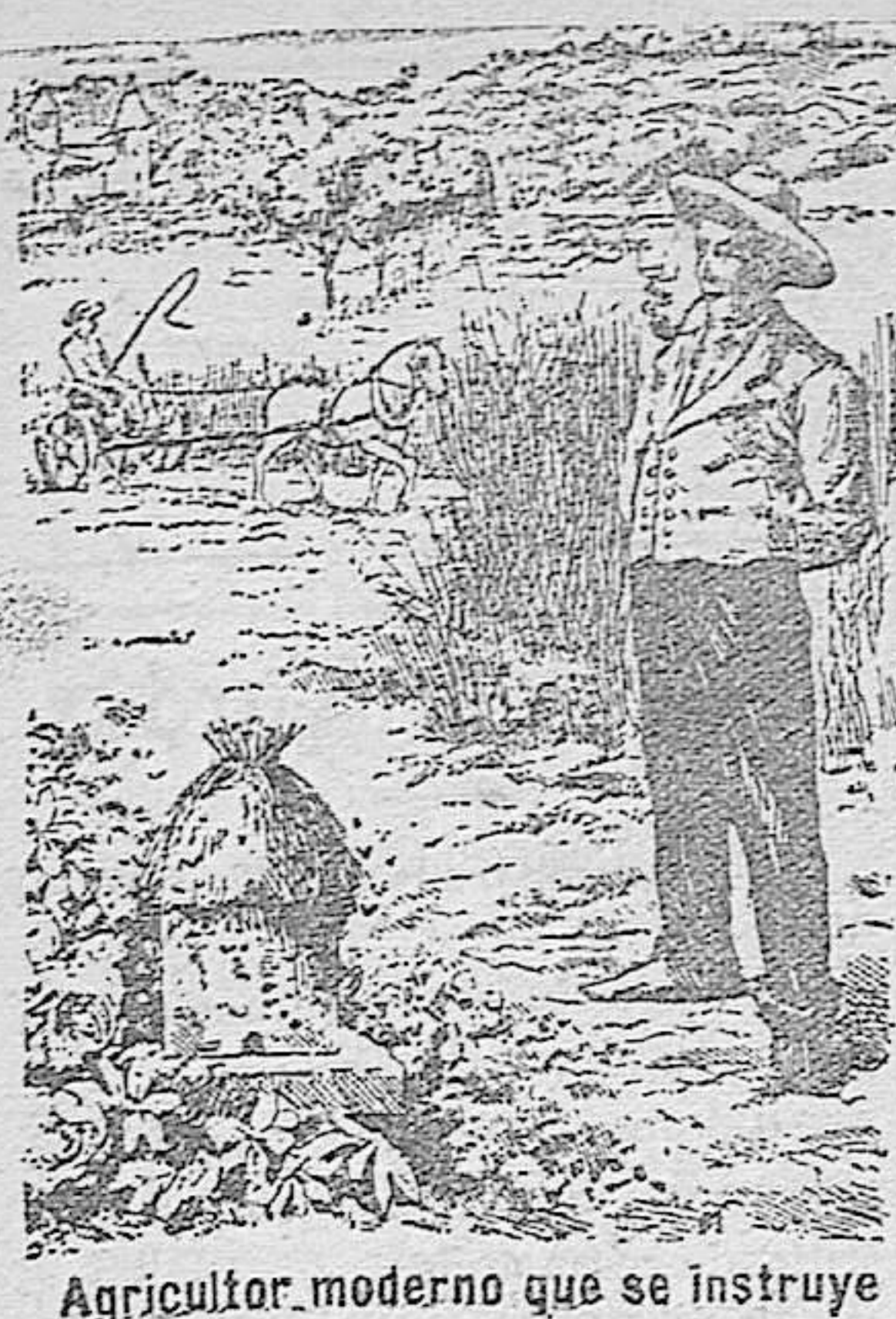
Agricultor moderno que se instruye