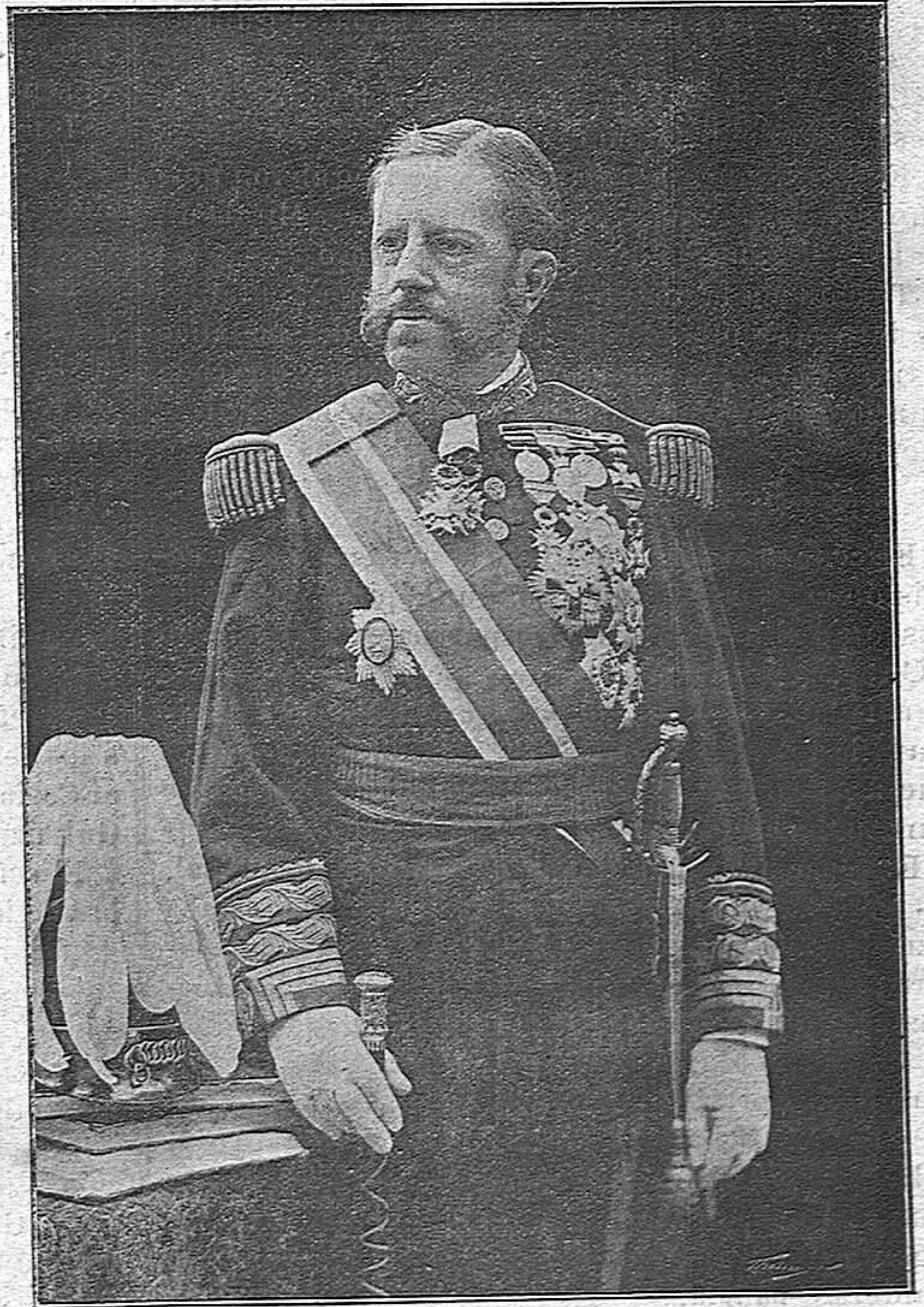
Excmo. Sr. D. Valeriano Weyler Capitan General de la Isla de Cuba

El Genio de la Historia conmovióse al oír gritos de guerra y escribió sobre páginas de gloria. Son los dominadores de la tierra, son los hijos de España, es la Victoria