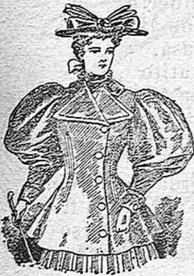
Saco de abrigo de paño azul marino, para joven de 12 á 14 años.