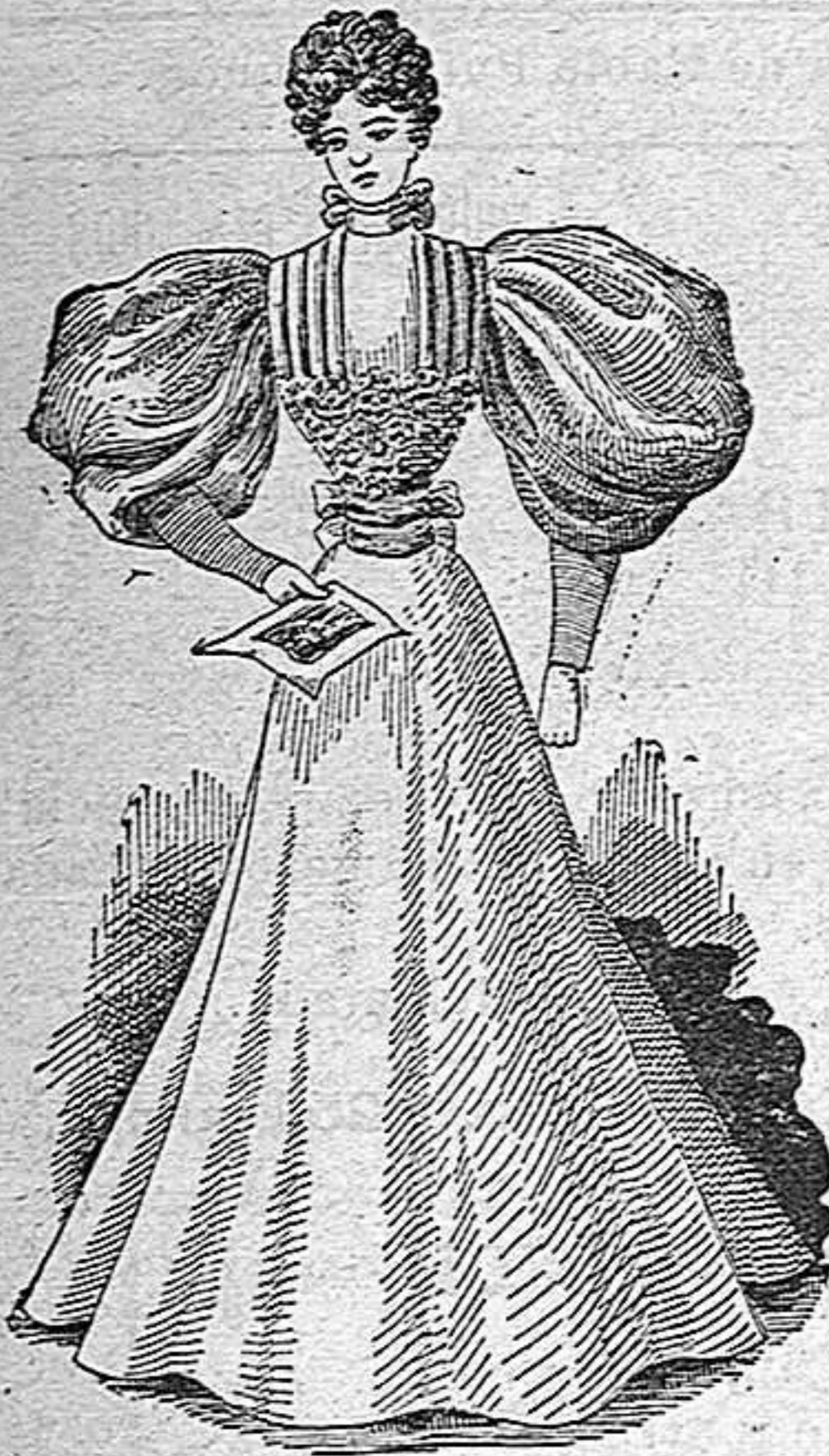
Vestido de lana para paseo.

Falda campana, muy ancha de abajo y de arriba recogida por la parte de atrás del talle. Cinturón alto, cubierto, formando cabezillas á cada lado. Cuerpo guarnecido de cada lado con pliegues aplanados sobre el delante unido. Corselete de blonda ceñido al talle igual por delante que por detrás, que se oculta por la falda. Manga de una sola pieza muy ancha de arriba y estrecha de abajo. Cuello cubierto de la misma tela. Materiales: 7 metros tela. 0'90 id. blonda y 0'50 id. terciopelo para el cinturón.