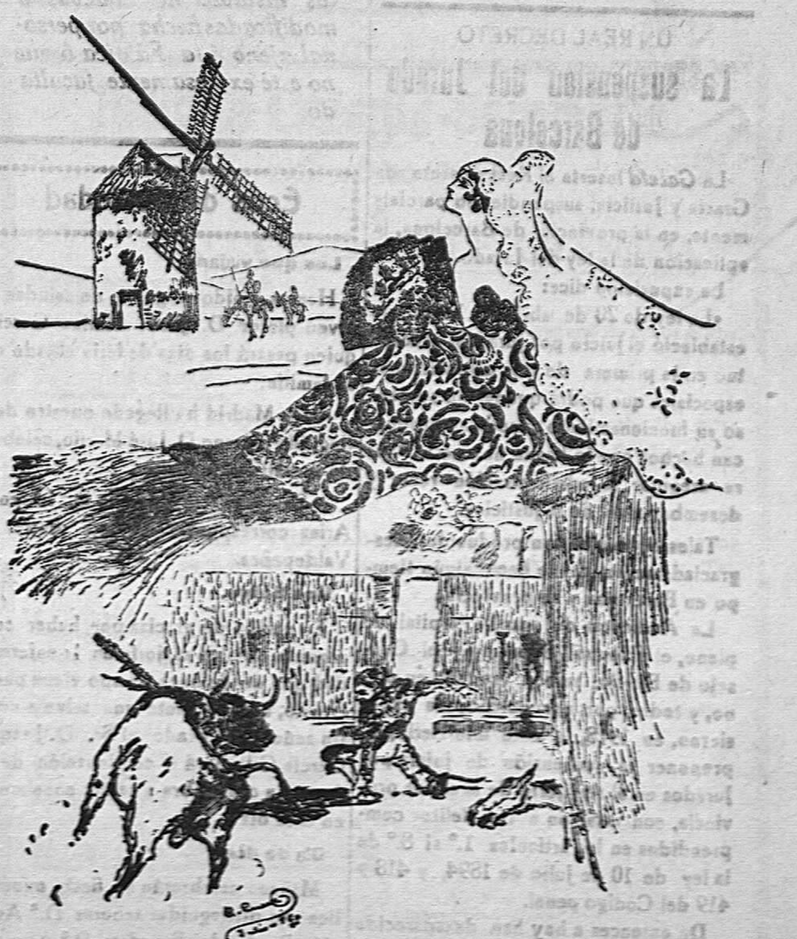
Luz y color (Dibujo de Rafael Cueva)