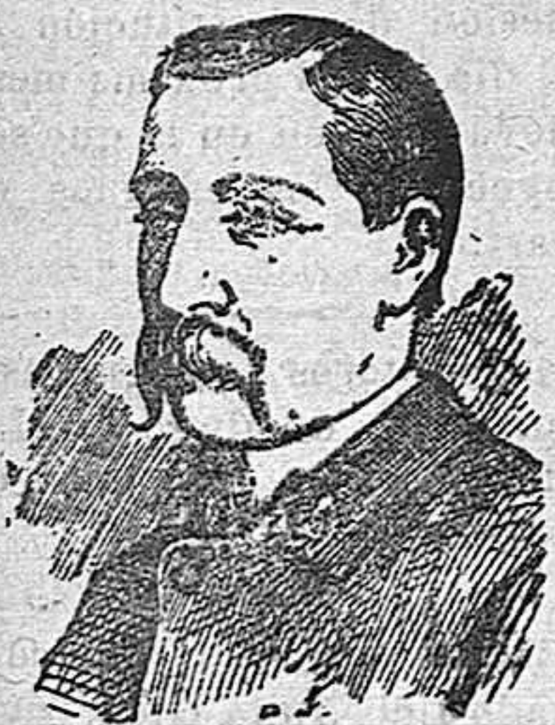
DON SEGISMUNDO MORET PRENDERGAST (Un retrato suyo del año 1869)

Un periódico madrileño de aquella época publicaba la fotografía de este hombre político, diciendo de él lo siguiente: