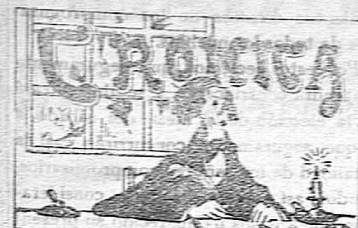
No va más