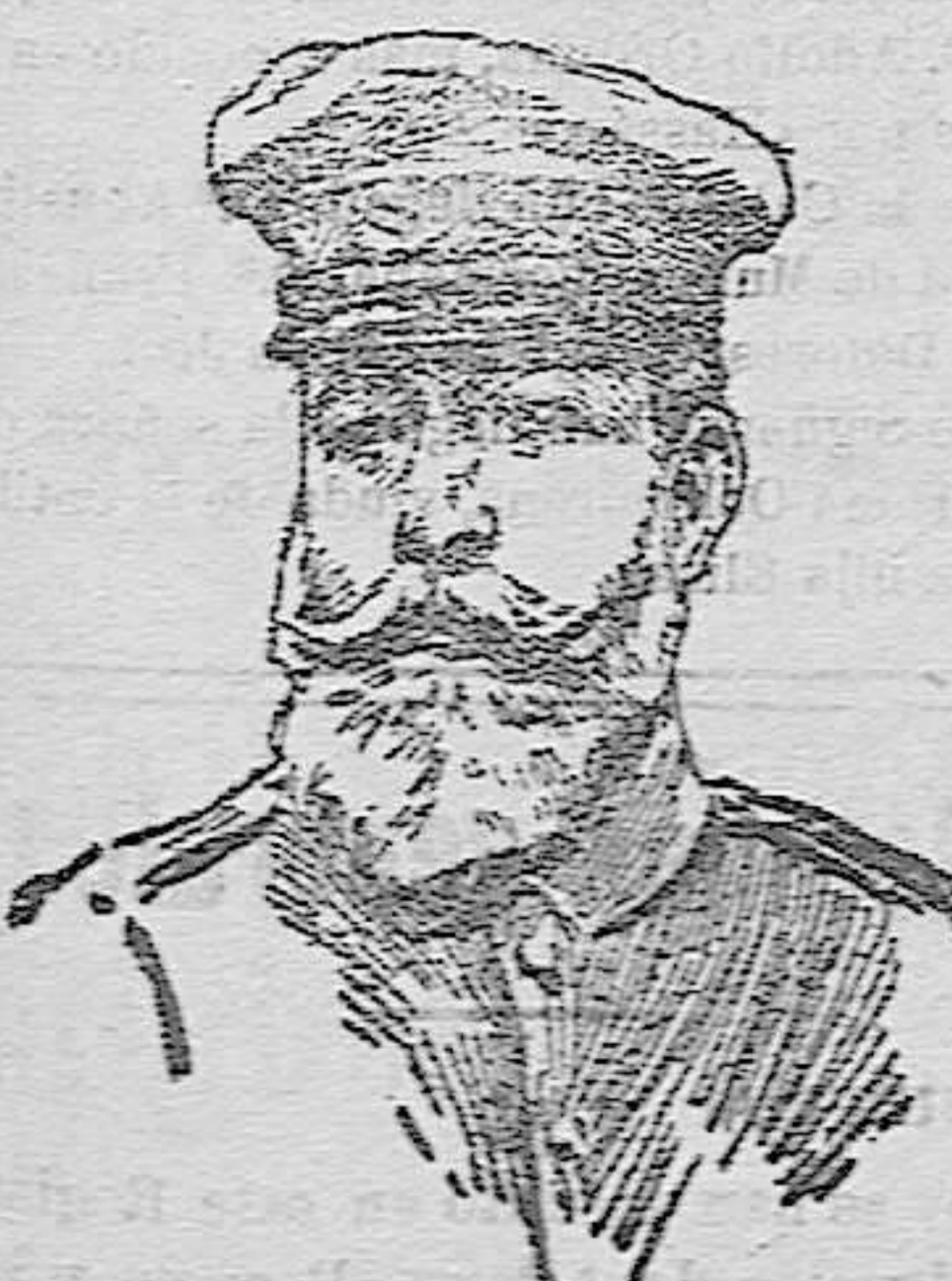
EL GENERAL Don José Marina, nuevo ministro de la Guerra