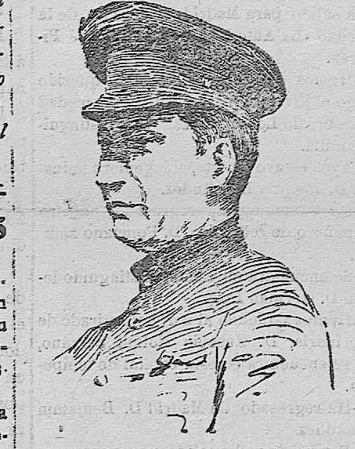
Kerensky, presidenta del Gobierno provisional y árbitro de los destinos de Rusia