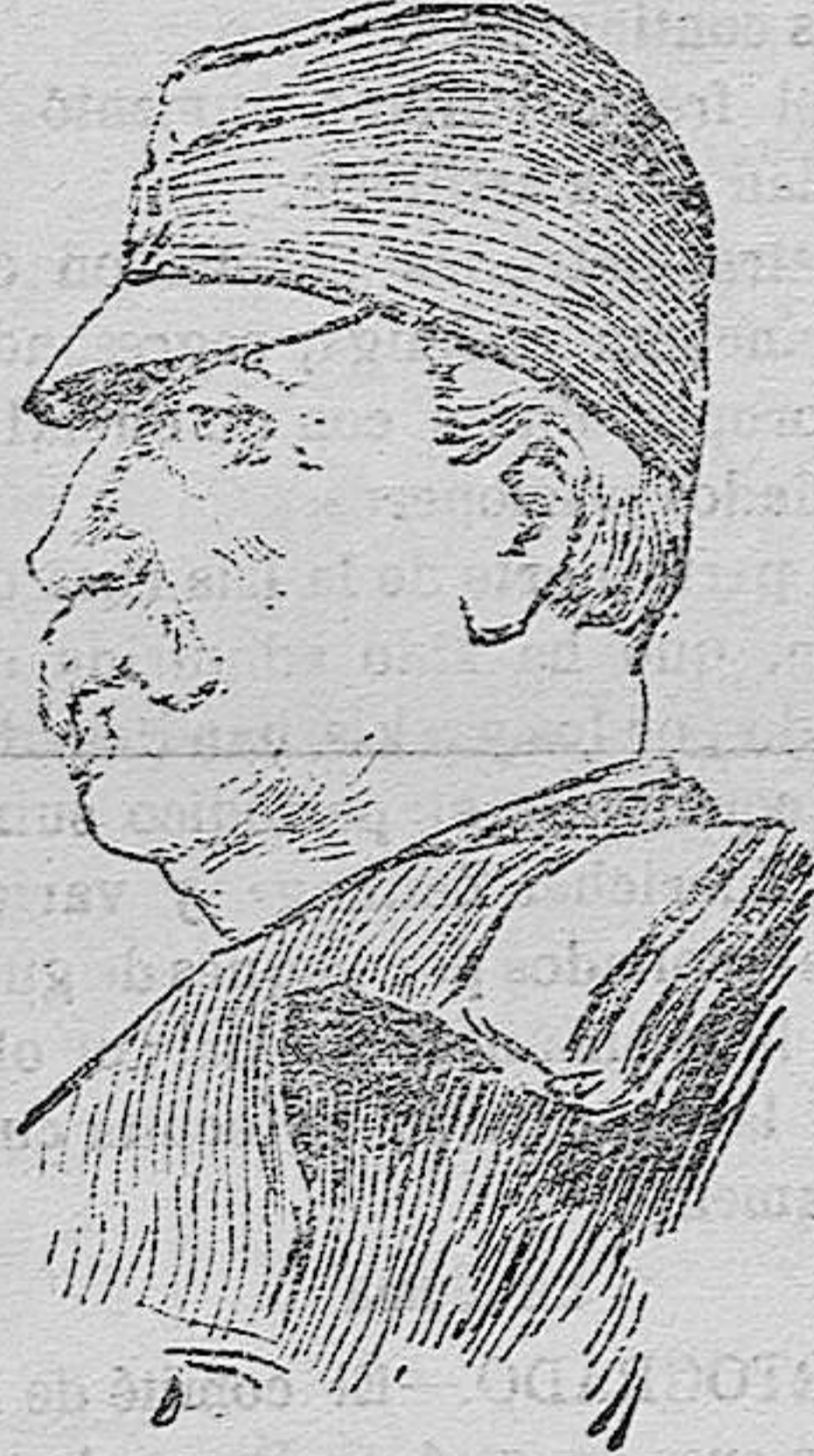
General Stefanovitch, comandante del ejército serbio que opera en el Nord-Este de Monastir