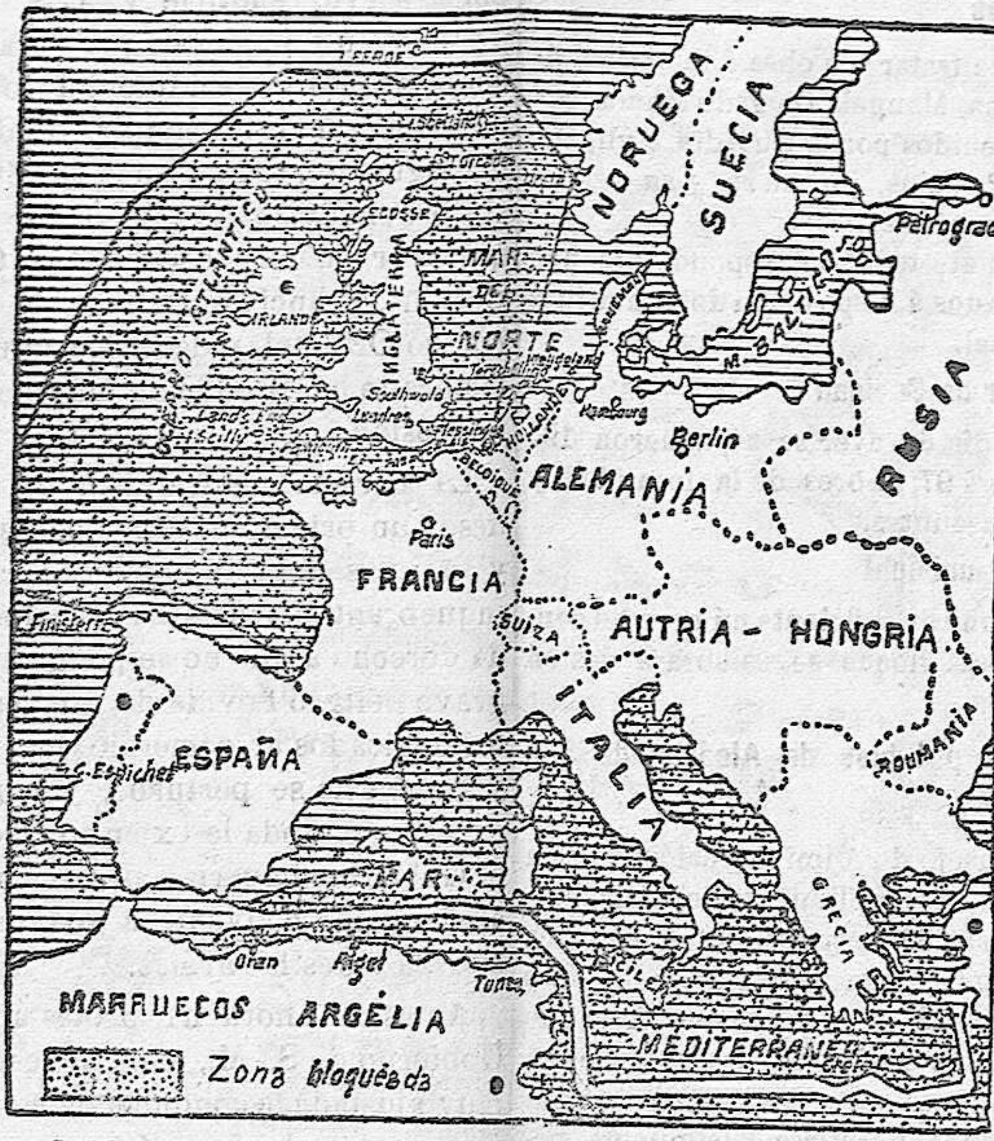
Gráfico de las zonas en que ha sido declarado el bloqueo por Alemania