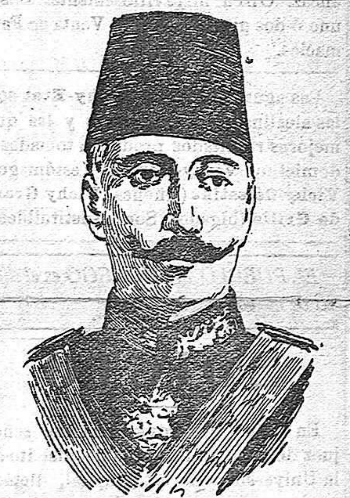
Partef Pachá, comandante de las fuerzas turcas que operan en la Macedonia griega