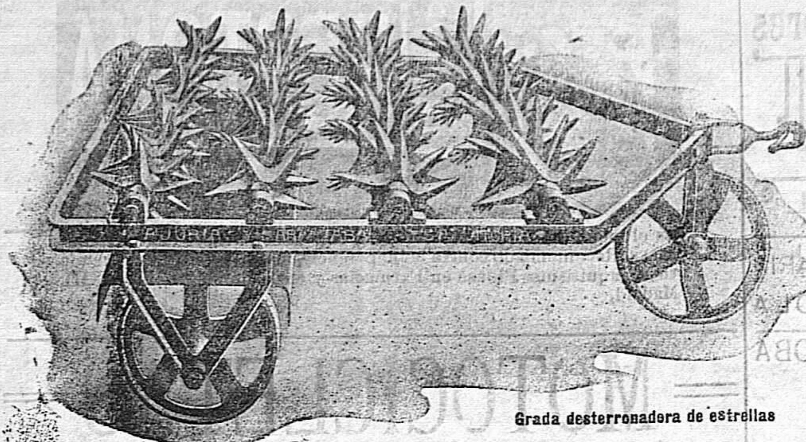
Grada desterradora de estrellas

PIDAN CATÁLOGOS VISITAR NUESTRA SUCURSAL DE CIUDAD REAL CALATRAVA, 5