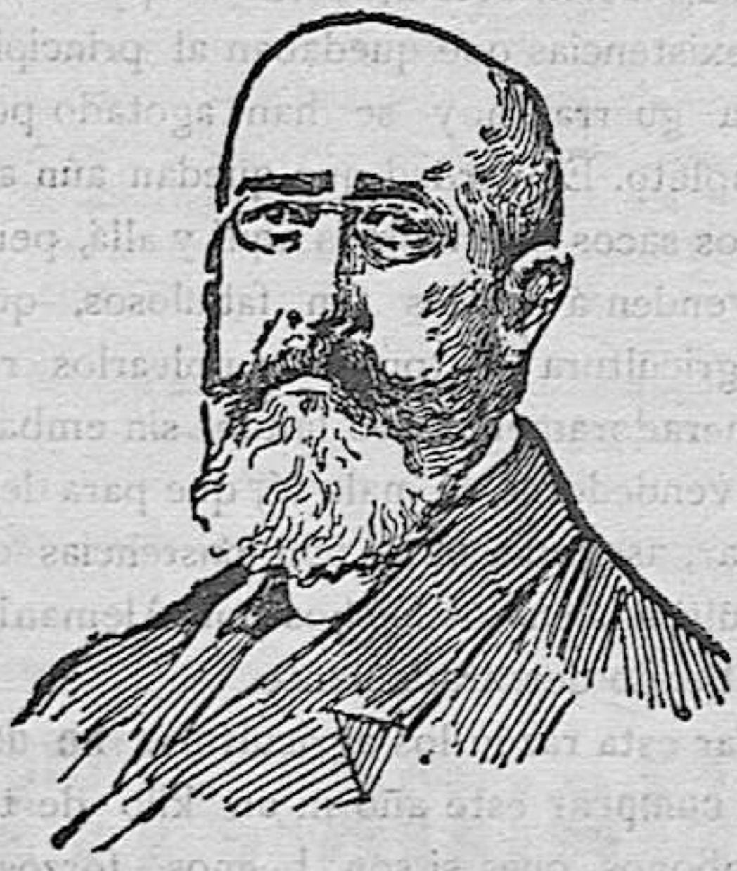
D. Juan Menéndez Pidal, ilustre literato y académico fallecido en Madrid