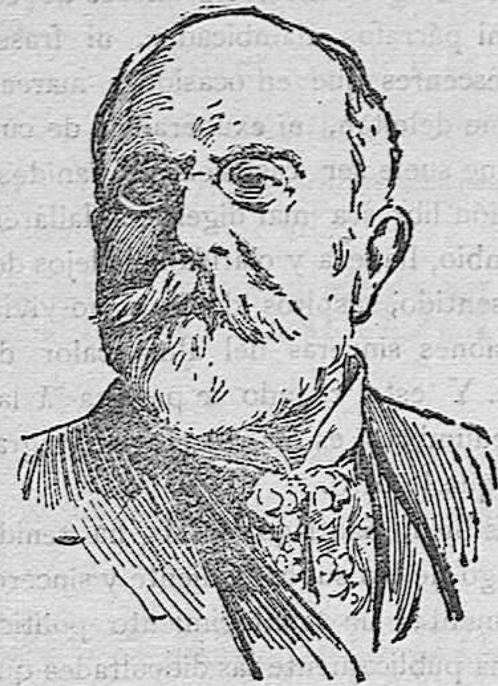
El Sr. Marqués del Muni, nuevo Embajador de España en París

3.ª Que dicho Museo social se establezca en un sitio céntrico de la capital (tercera casa Consistorial, etc.) para que su visita y estudio sea fácil á todas las clases sociales.