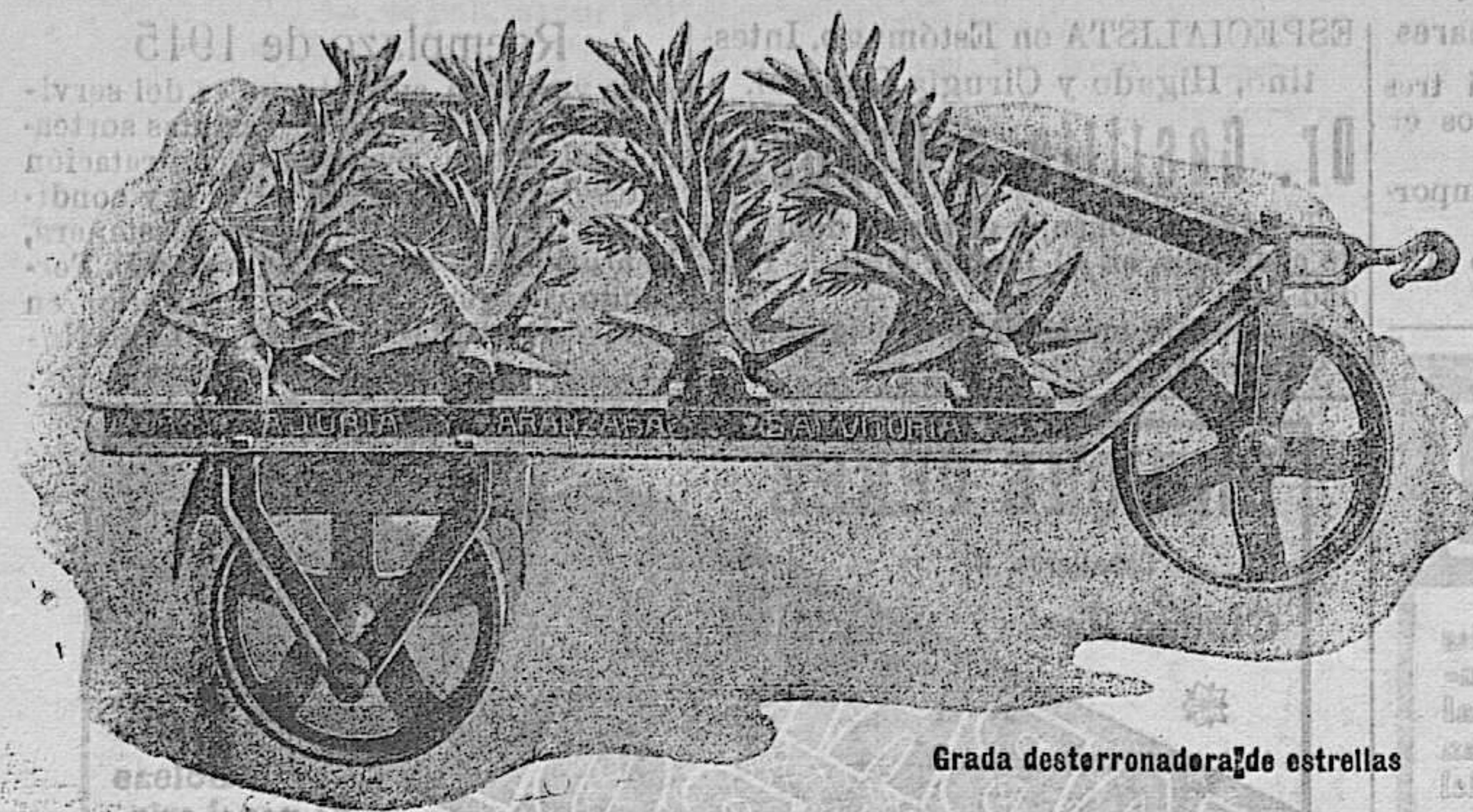
Grada desterradora de estrellas

PIDAN CATÁLOGOS VISITAR NUESTRA SUCURSAL DE CIUDAD REAL CALATRAVA, 5