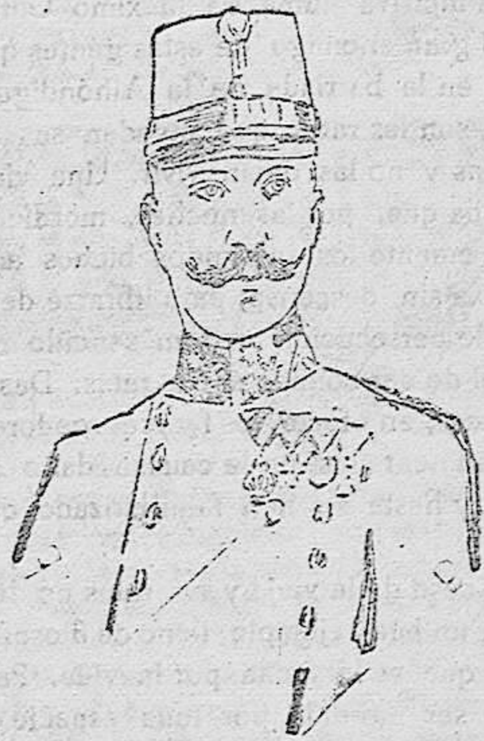
GENERAL AUSTRIACO BOCHIN-ERMOLIN, CUYO EJÉRCITO OPERA EN LA WOHYNIA