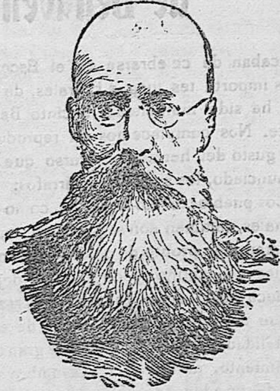
Figuras de la guerra