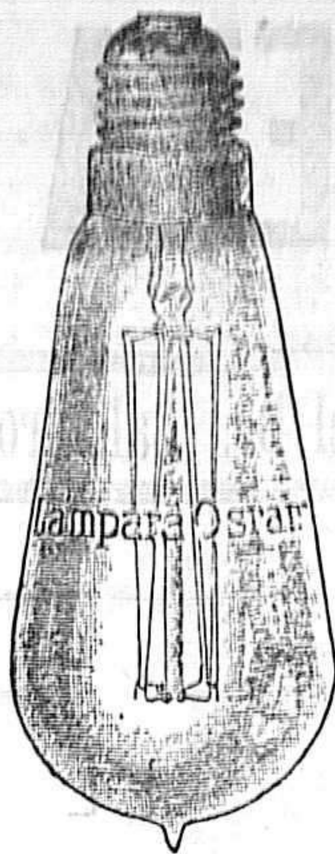
Exijase la marca OSRAM grabada en el cristal