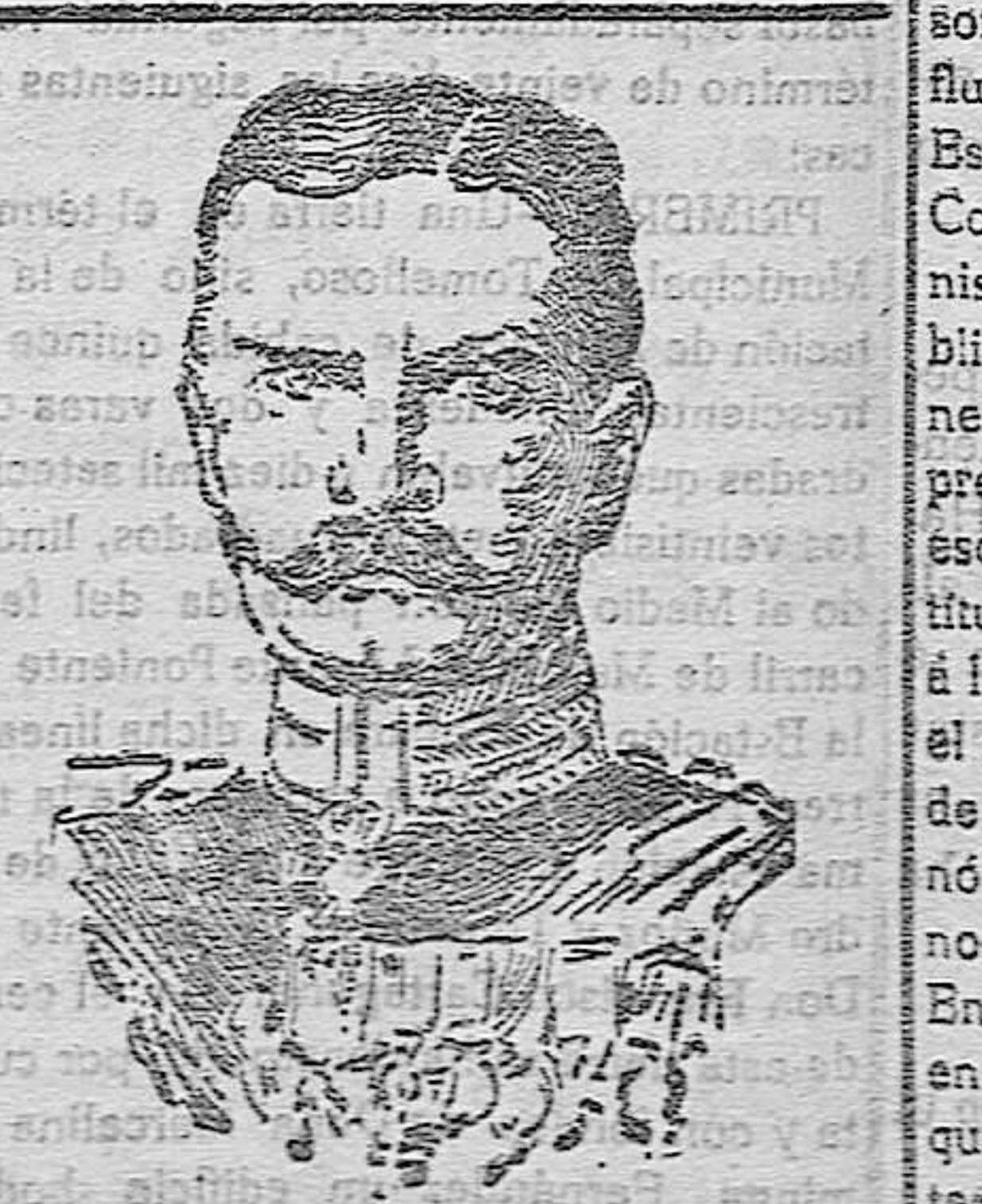
General von Makowsen

COMANDANTE DE UNO DE LOS EJÉRCITOS ALEMANES DE POLONIA Y CONQUISTADOR DE LOZ