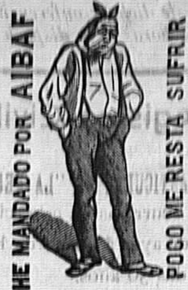
THE MANDADO POR AIBAF

Consignatarios en Barcelona, RIPOL y Compañía, Dormitorio de San Francisco, 25 pral.