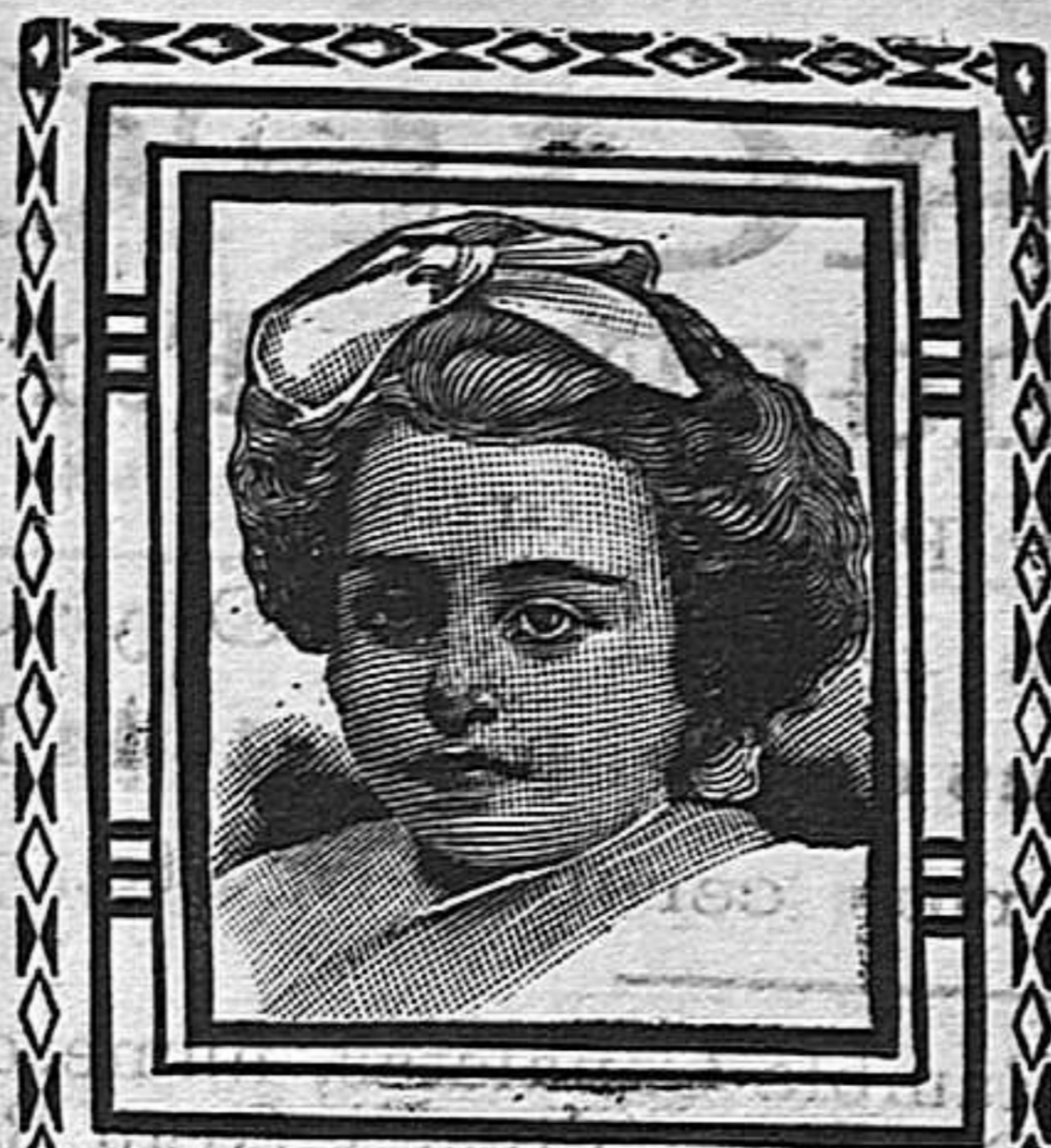
Barcelona, 11 Febrero 1908.

El ministro de Hacienda y el gobernador del Banco, antes del Consejo de ministros, conferenciaron durante hora y media. La conferencia ha tenido importancia, tratando de la cuestión monetaria, cuyo asunto ha sido el primero discutido en el Consejo.