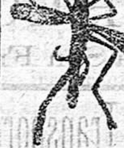
ANOFELE Mosquito que propaga la fiebre Subida San Miguel 1, Barcelona palúdica.

Rogamos a los Sres. Doctores que lo ensayen en los casos que resultaren incurables con cualquier otro tratamiento, con la seguridad de que después no lo abandonarán nunca.