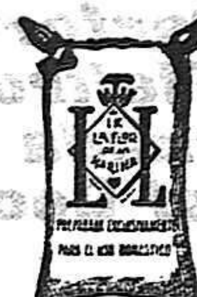
Flocina frappé (1 Kilo)