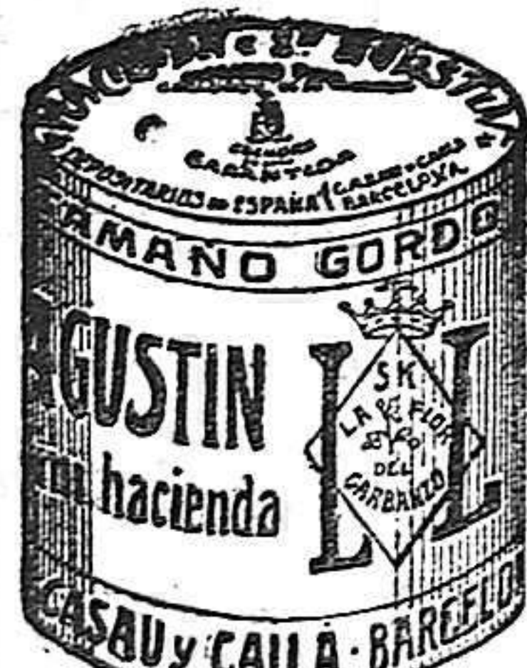
Garbanzo Sauco (5 Kilos)

Las esquelas mortuorias para insertarlas en LA LUCHA se admiten hasta las 3 de la tarde las de la 1.ª página y las de la 2.ª y 3.ª hasta las 5.