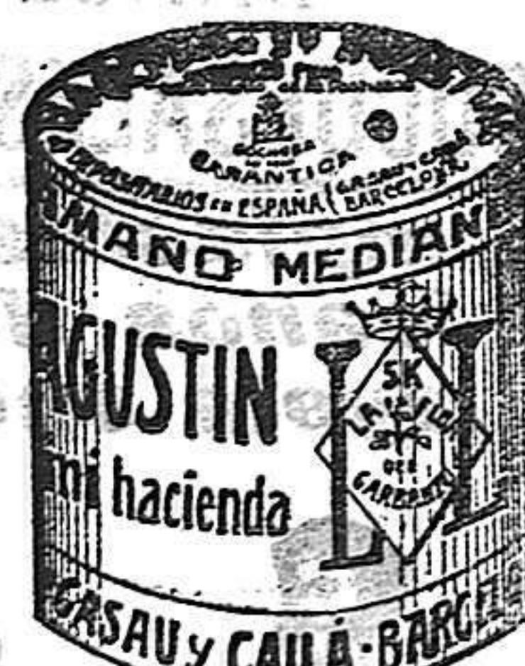
Garbanzo Sauco (5 Kilos)

Garantizamos al público que los comestibles empaquetados con nuestra marca son naturales de la planta, y sin contener la más pequeña adulteración en beneficio de ellos ni para hermostrarlos, por lo cual nos hacemos responsables á todo análisis que quiera efectuarse.