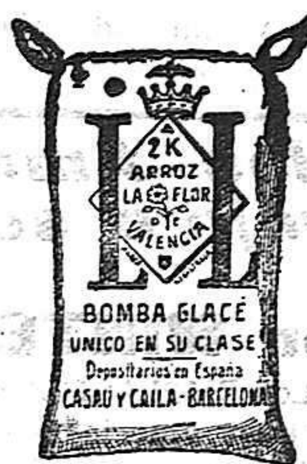
Arroz Glacé (2 Kilos)