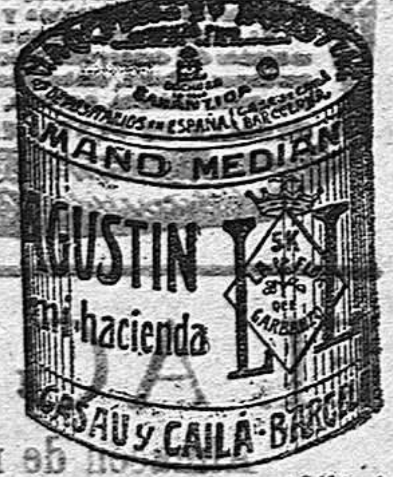
Garbanzo Sauco (5 Kilos)

Garantizamos al público que los comestibles empaquetados con nuestra marca son naturales de la planta, y sin contener la más pequeña adulteración en beneficio de ellos ni para hermosarlos, por lo cual nos hacemos responsables á todo análisis que quiera efectuarse.