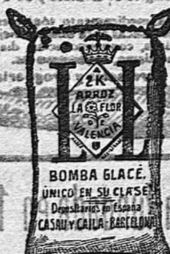
Arroz Glacé (2 Kilos)