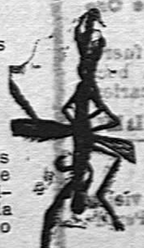
ANOFELE Mosquito que propaga la fiebre palúdica.

Previene el paludismo y lo cura en todas sus formas DOSIS CURATIVA: 6 pildoras diarias durante 15 días DOSIS PREVENTIVA Y RECONSTITUYENTE: 2 pildoras diarias. Rogamos á los Sres. Doctores que lo ensayen en los casos que resultaren incurables con cual- quier otro tratamiento, con la seguridad de que después no lo abandonarán nunca. Depósito, ALFREDO ROLANDO Subida San Miguel 1, Barcelona