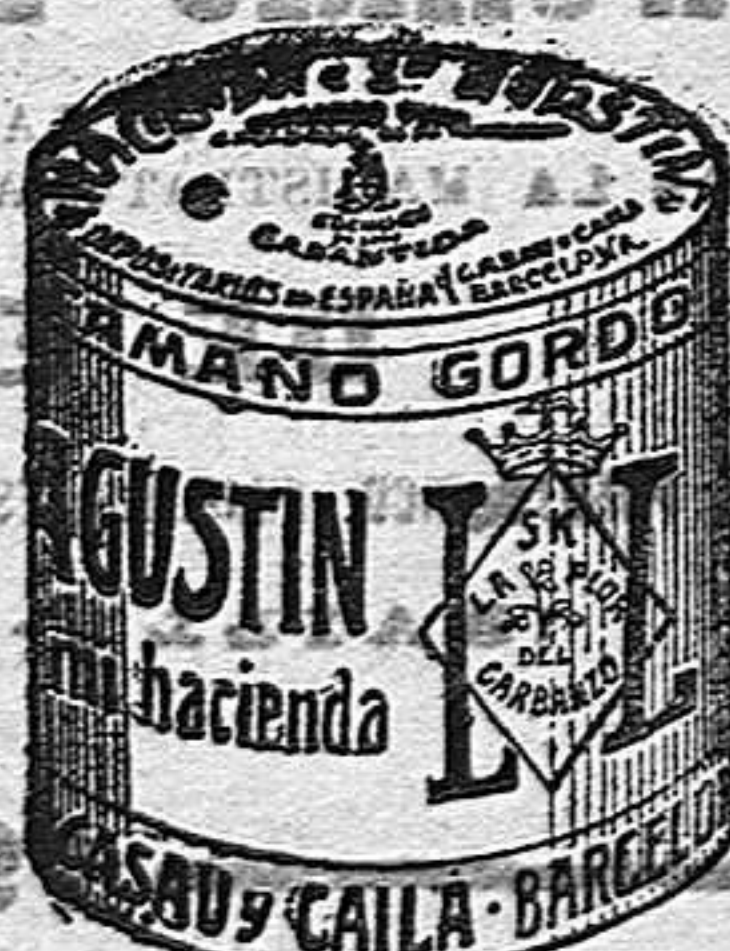
Garbanzo Sauco (5 Kilos)

EN LAS FARMACIAS Y DROGUERIAS DEPOSITO A. ROLANDO BARCELONA