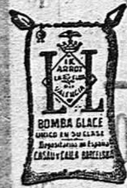
Arroz Glacé (1 Kilo)