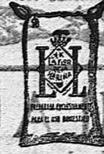
Harina Frappé (1 Kilo)