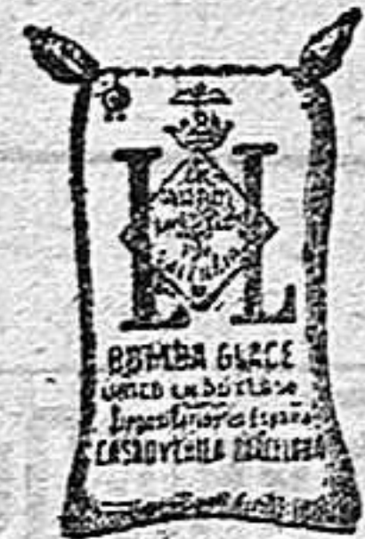
Arroz Glacé (1 Kilo)