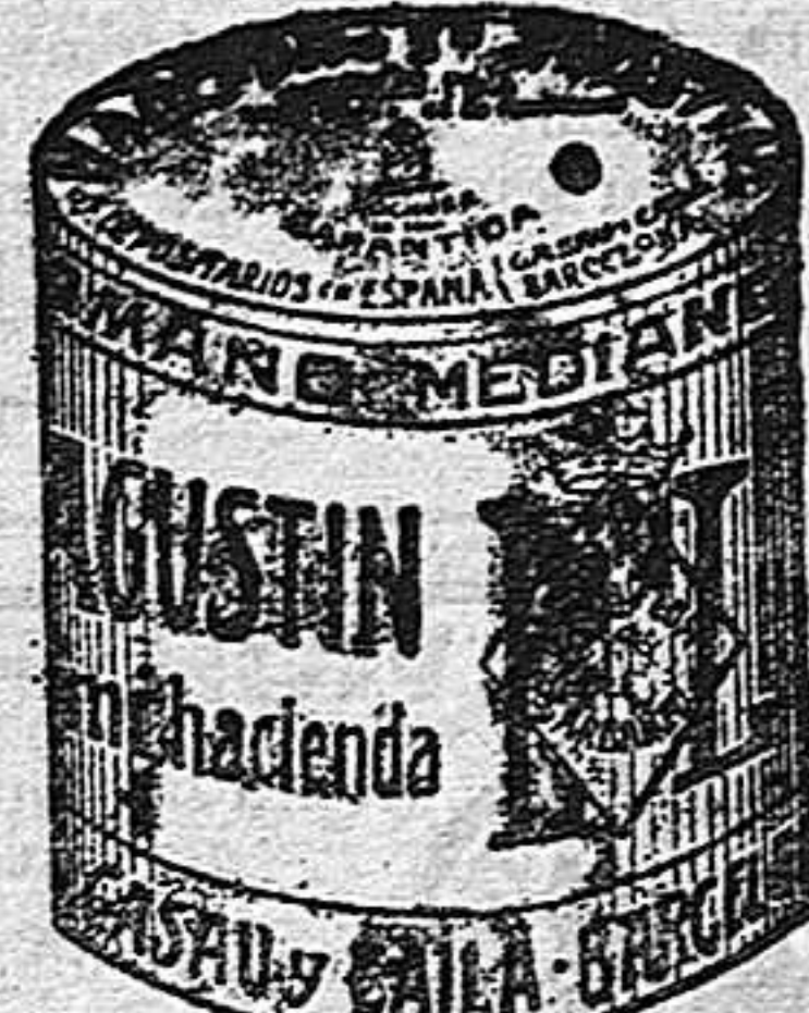
Garbanzo Sauce (5 Kilos)

Garantizamos al público que los comestibles empaquetados con nuestra marca son naturales de la planta, y sin contener la más pequeña adulteración en beneficio de ellos ni para hermosarlos, por lo cual nos hacemos responsables á todo análisis que quiera efectuarse.