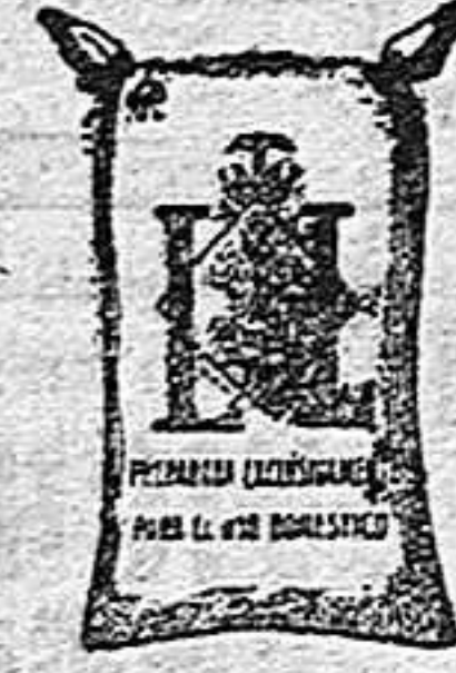
Harina Frappé (1 Kilo)