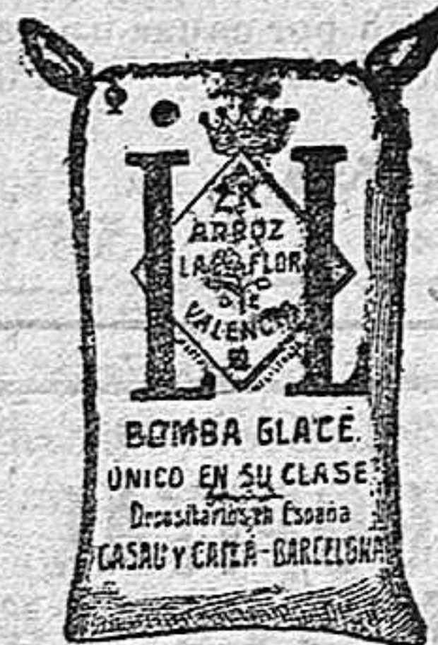
Arroz Glacé (2 Kilos)