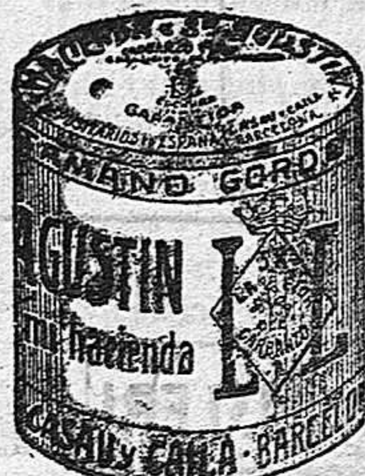
Garbanzo Sauce (5 Kilos)