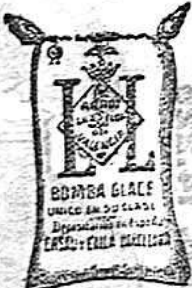
Arroz Glacé (1 Kilo)