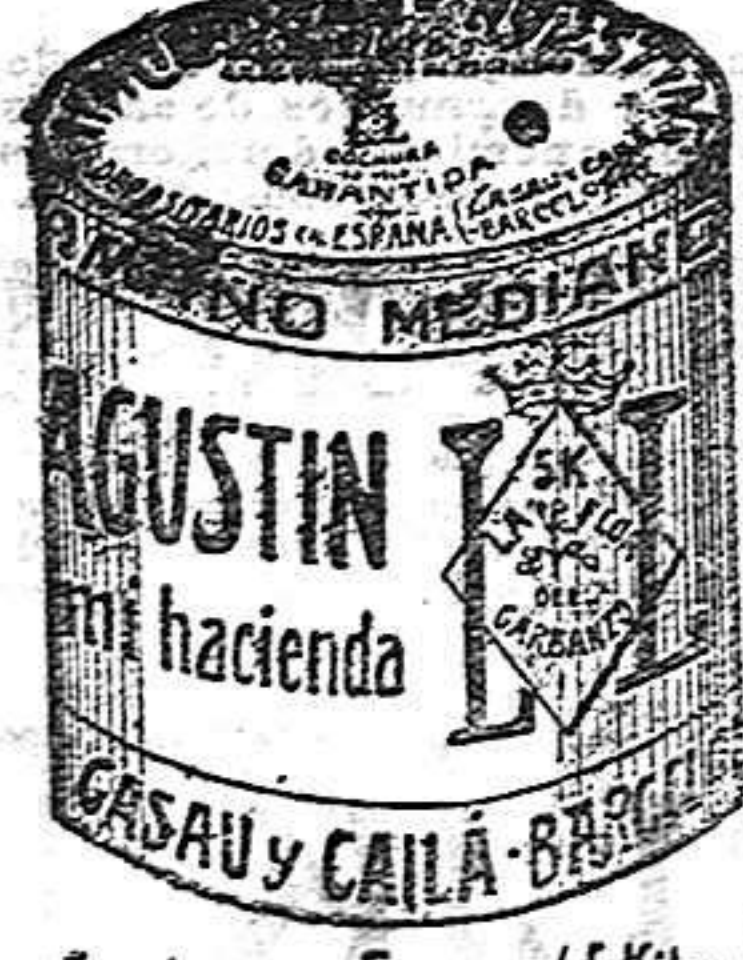
Garbanzo Sauco (5 Kilos)

Garantizamos al público que los comestibles empaquetados con nuestra marca son naturales de la planta, y sin contener la más pequeña adulteración en beneficio de ellos ni para hermostrarlos, por lo cual nos hacemos responsables á todo análisis que quiera efectuarse.