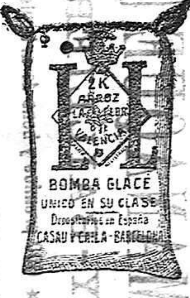
Arroz Glacé (2 Kilos)