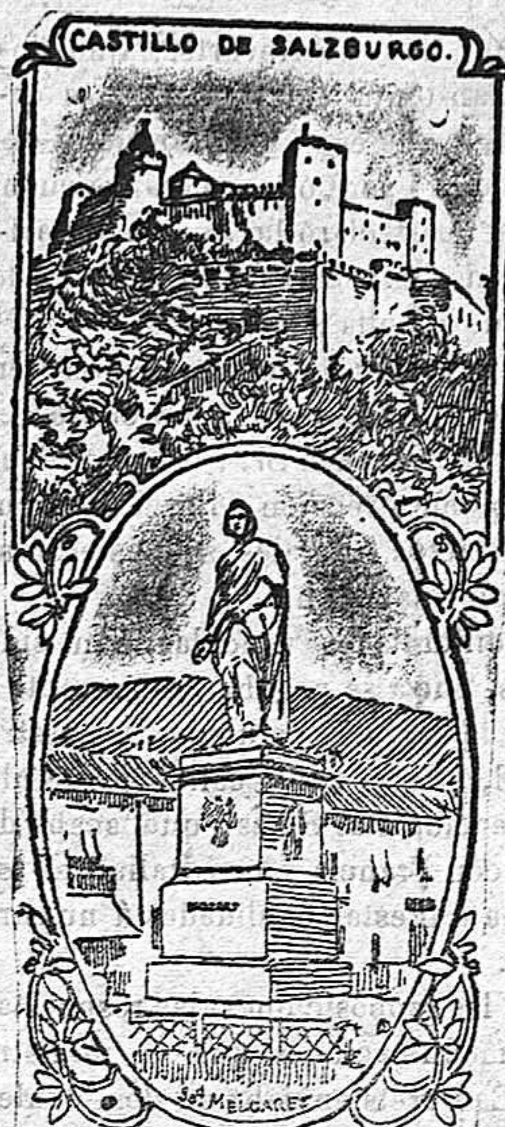
LA ESTATUA DE MOZART EN SALZBURGO

Durante siete días consecutivos se celebrará la memoria de Mozart, tanto en sus óperas como en las obras sinfónicas, escogidas entre lo más selecto de su repertorio.