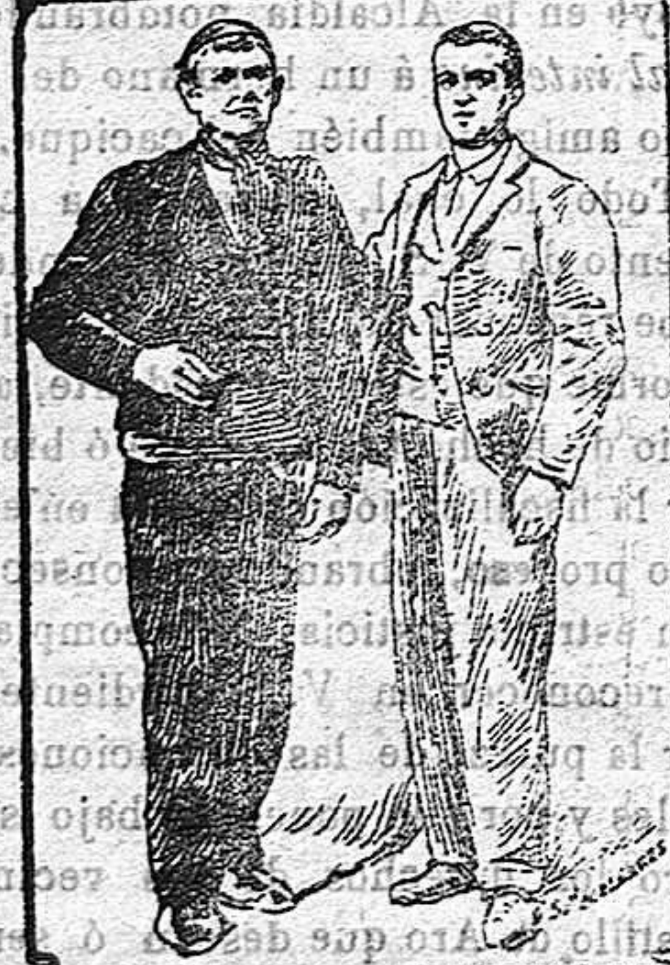
LOS REOS INULTADOS DE MAZARETE.

En el mes de Agosto de 1904 empezó sus gestiones; en el mes de Agosto de 1906 vió coronados sus esfuerzos con el indulto total de los supuestos reos, propuesto por el sentir unánime de los ministros y firmado por el Rey.