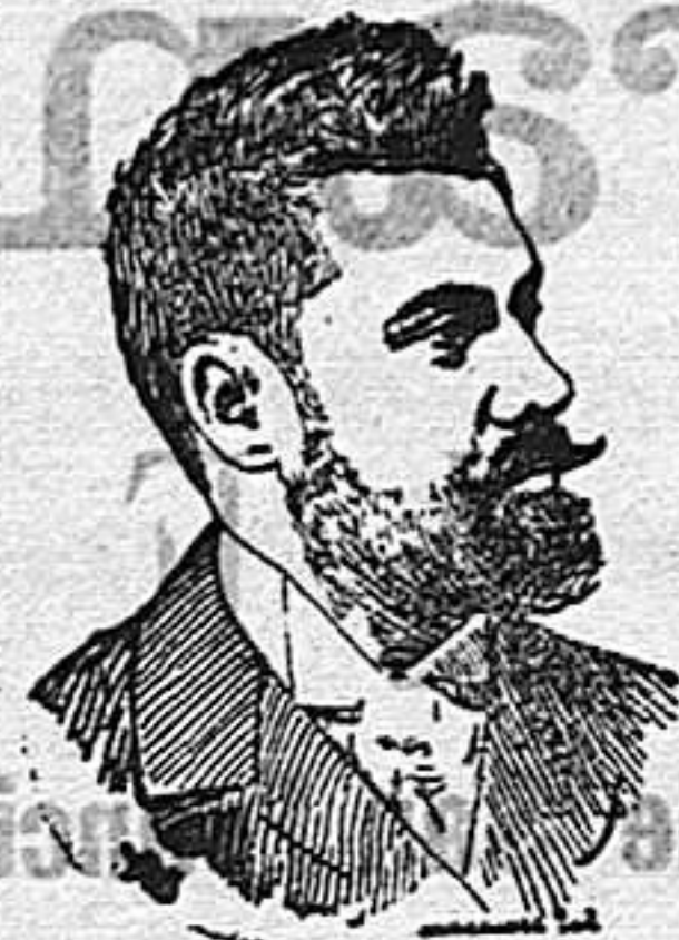
SANTIAGO ALBA Gobernador civil de Madrid