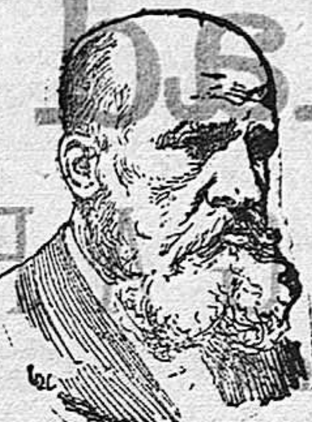
ALBERTO AGUILERA alcalde de Madrid