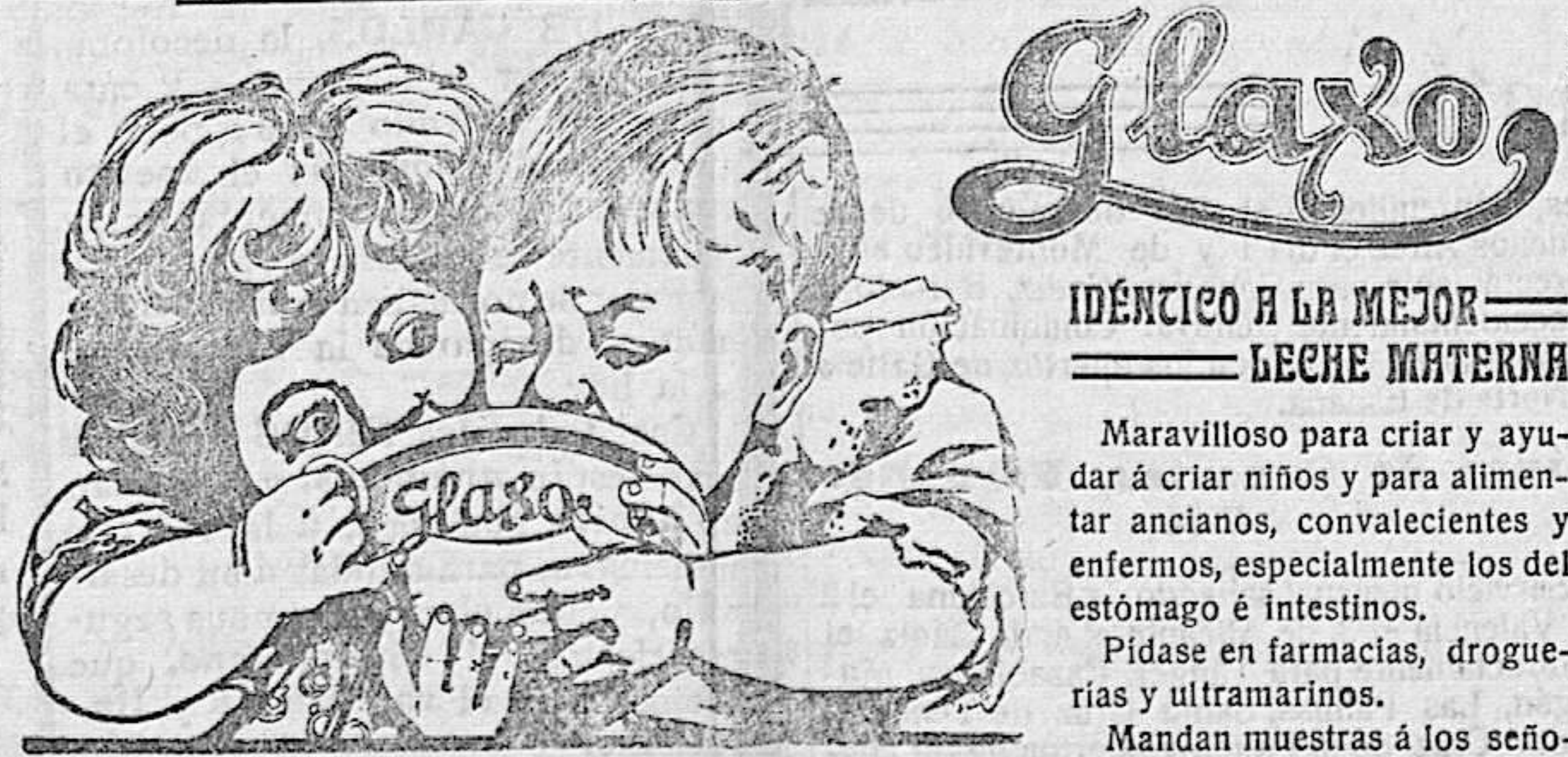
Idéntico á la mejor LECHE MATERNA

Champagne Benezét MEDIO SECO SECO Y DULCE Para pedidos: E. BENEZÉT ZANCARA (CIUDAD REAL)