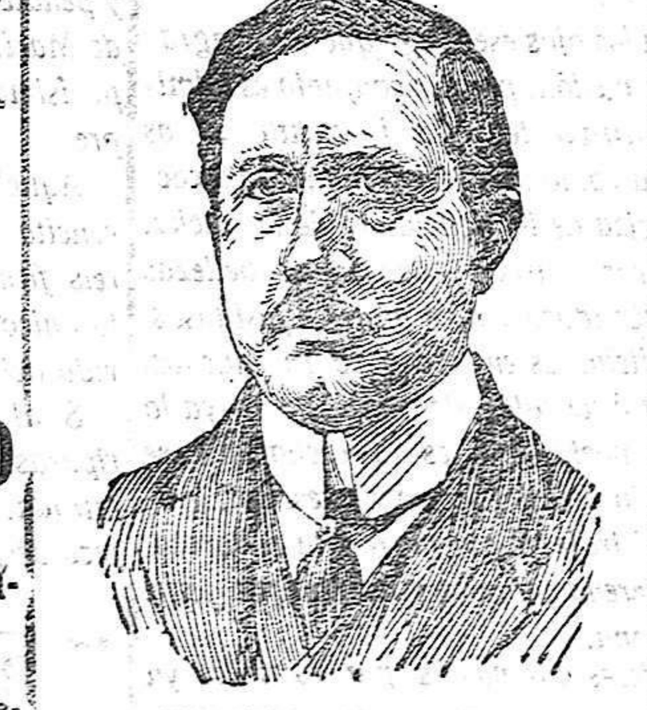
El hombre se tenía por objeto filmar el desce de los concurrentes a él, de que «Azorin» sea académico, para corregir una desatención injusta.