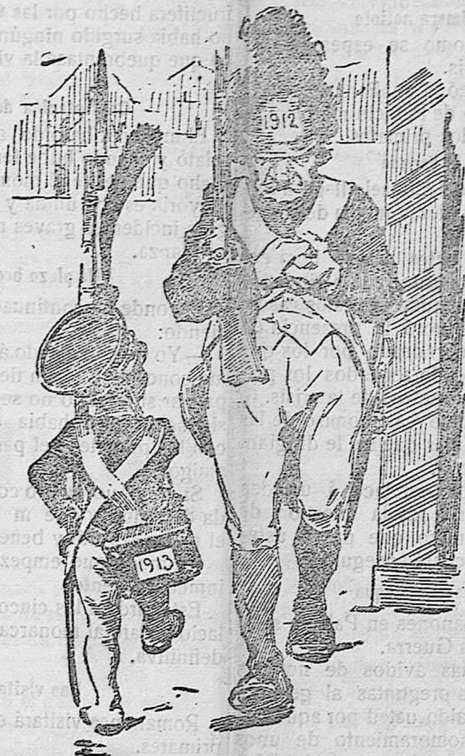
LÁRGATE DE AQUÍ, ninchi, QUE SONÓ LA HORA DEL RELEVO