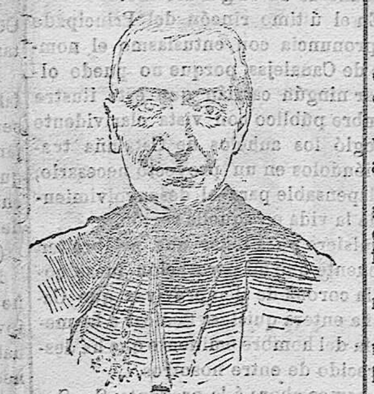
Mr. Capcelatro CARDENAL BIBLIOTECARIO DE LA IGLESIA BOVIANA, QUE ACABÁ DE FALLECER EN ROMA

que ante nosotros, amensador, ufano porque se regoda al amparo de censurables libertades de inmunidades injustas, pero que en sí, es sólo ruido formidable de moscardón, que se apaga, que se extingue al conjuro de un leve manotazo. Defensa pide la opinión contra las proclamas y libelos de esa Prensa engañosa que se vale de la incultura de las clases bajas, para el logro de sus campañas ruinosas. Es bien triste y vergonzoso que, callente aún el cuerpo del infortunado gobernante muerto, se diga en un periódico radical que el asesinato estuvo justificado al ser la víctima otro honrado gobernante, vive: el Sr. Maura. No consentimos; pero, repitamos al formular, que es España, España entera la que ante estos hechos pide represión al libertinaje actual siendo urgente que nuestro Gobierno escuche ese grito unánime de la opinión, planteando un problema que, entre otros bienes, nos trae á la idea de conocer mejor, á muchos males españoles. Ese será el mejor homenaje á la memoria de la víctima. Porque la Democracia, no puede amparar malas pasiones ni criminales instintos, ni puede entregar á la sociedad indifensa en manos de sus verdugos.