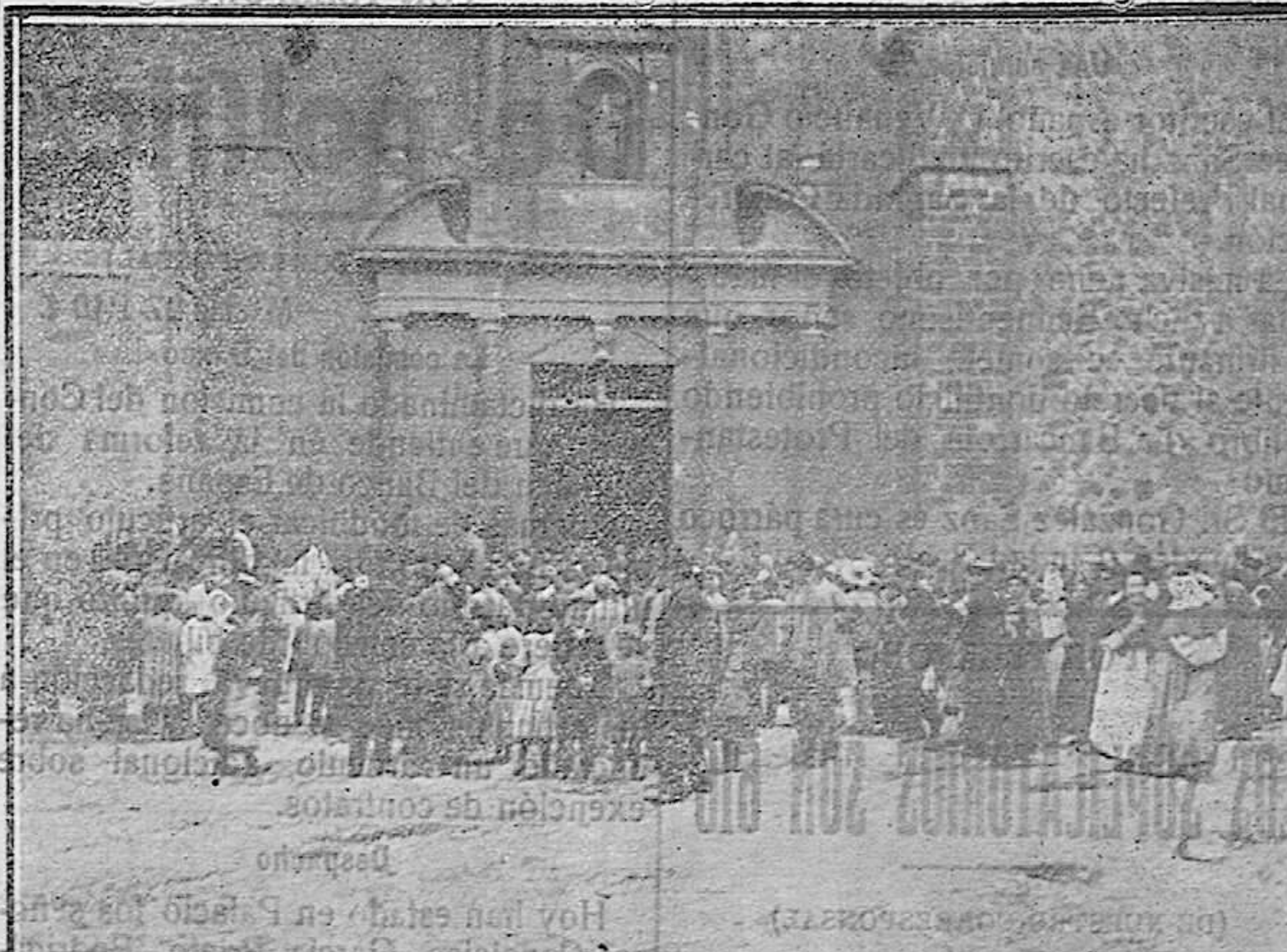
IGLESIA PARROQUIAL DE LA SOLANA. Público que no pudo entrar en el local, por hallarse totalmente ocupado, momentos después de la llegada del Sr. Obispo.

Junto a los depósitos que no se si hemos dicho que se hallan al otro lado