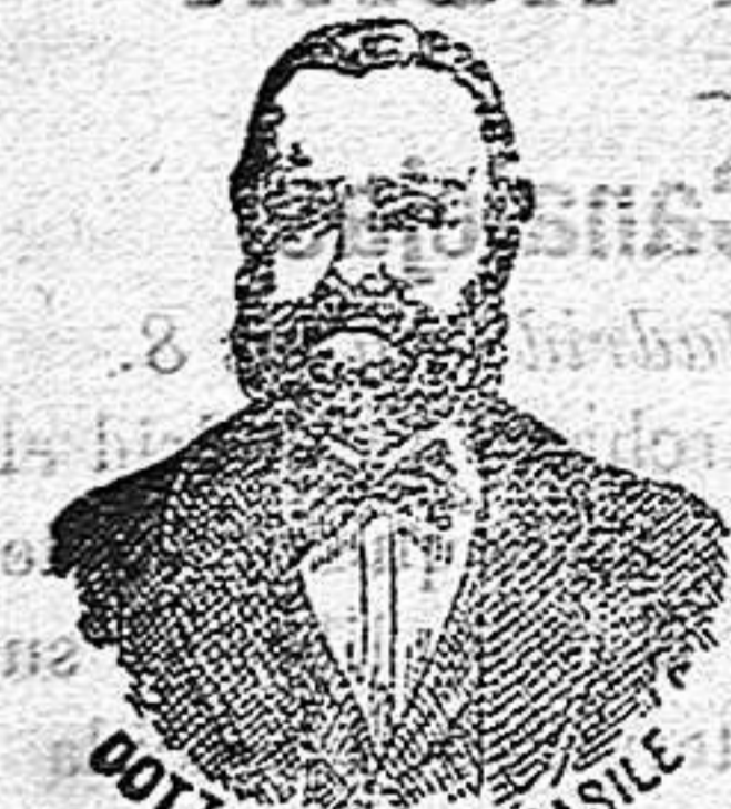
INVENTOR DE LOS RENOMBRADOS MEDICAMENTOS CASILE DIPUTACION, 435, BARCELONA.

han logrado que el Dr. Casile descubriera los milagrosos medicamentos que curan infaliblemente la tisis en cualquiera de sus periodos y todas las enfermedades del estómago. A la más pequeña manifestación de un resfriado, tos, catarro, bronquitis, gripe, asma (sofocación) expectoración y de cualquier enfermedad del pecho, tomar inmediatamente las Perlas Casile , que no solo curan infaliblemente estas enfermedades sino que se tendrá la completa seguridad de no contraer otras mucho más graves. Siguiendo este método se podrá decir no más tisis . Si por desquido no se hubiera seguido este tratamiento y por desgracia cualquier persona se encontrara atacada de tisis, no tiene que apurarse, porque gracias á los cons antes estudios, hemos podido encontrar los renombrados CONFITES CASILE , que asociados á las Perlas combaten con eficacia la tisis en cualquiera de sus periodos.