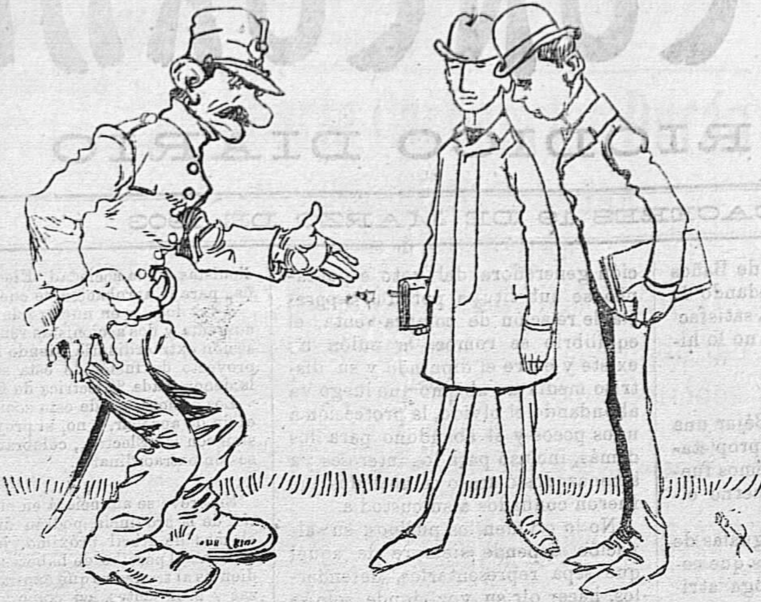
Me estáis haciendo pasar más penas que el caracol, que lleva su casa auestas, con más fatigas que Dios.

Por tanto, el primer método para fijar lo invisible sobre la placa es el de hacer representar, reduciéndose la primera operación a estudiar la intensidad de la luz y el tiempo de exposición y determinar los reactivos más sensibles para la impresión, fijación y reforzamiento de las placas.