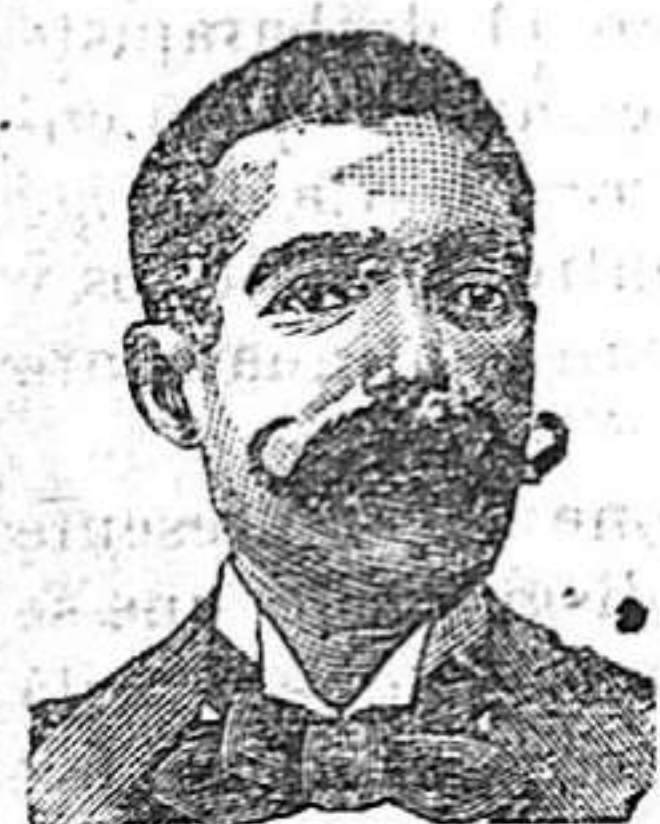
A. Sarrati Costanzi Diputación, 435, Barcelona

PROCURADOR.—San Francisco 22, 1.º 2.—TARRAGONA