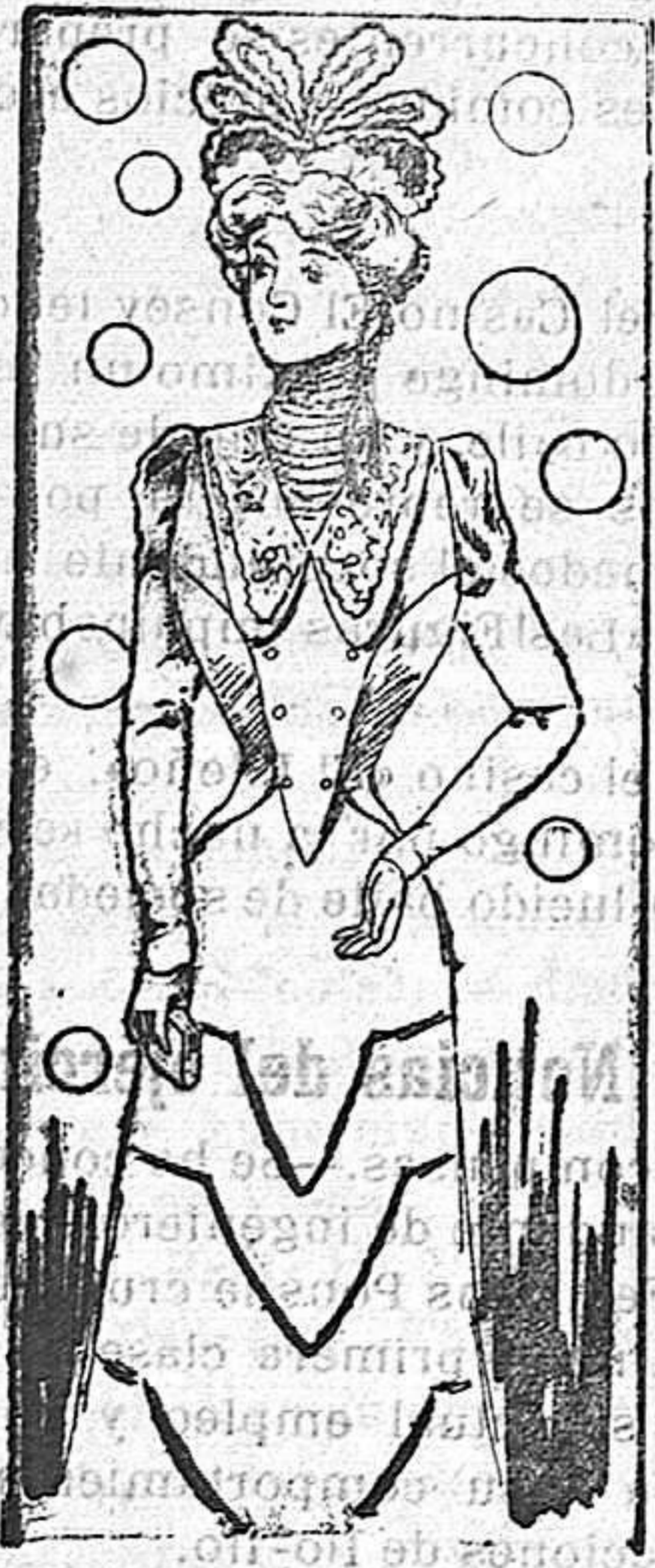
Modelo para otoño

nesú adornado con cordones formando tres tiras horizontales. De este mismo canesú se forma el cuello. Debajo del canesú y formando los ángulos que se ven en el dibujo, se colocan dos cintas iguales a la que se destina para sujetar la cintura. Mangas rectas con un pequeño bollo en los hombros y falda acampanada.