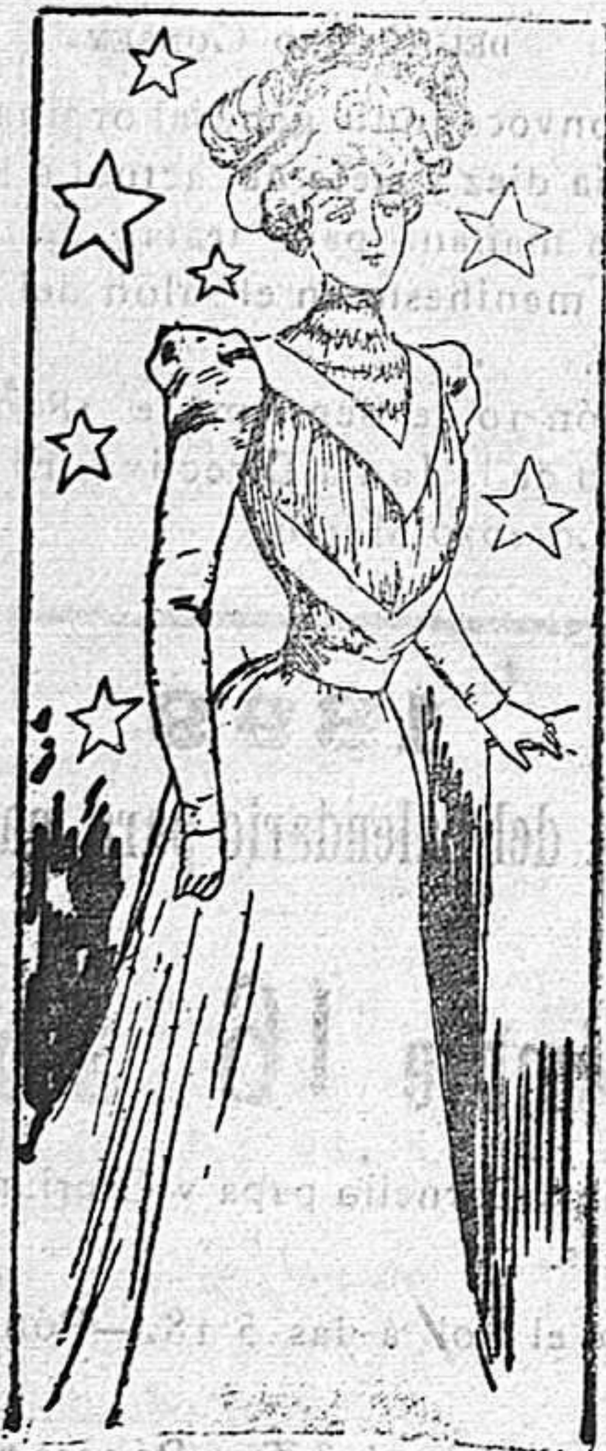
Traje para señorita

Modelos exclusivos para nuestras lectoras, de los grandes almacenes de EL SIGLO, Barcelona: (1).