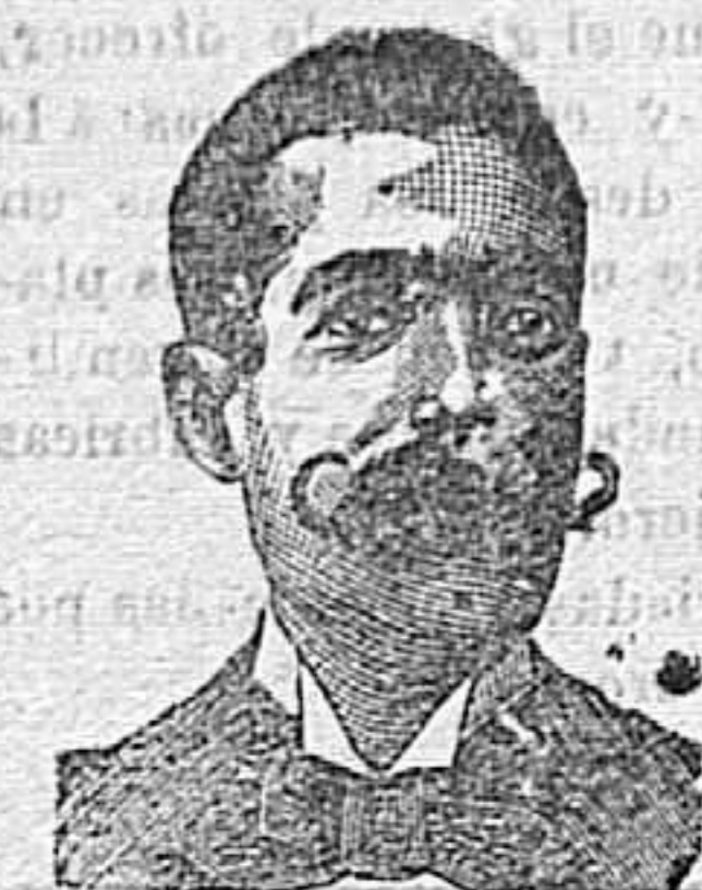
A. Salati Costanzi Diputación, 435, Barcelona