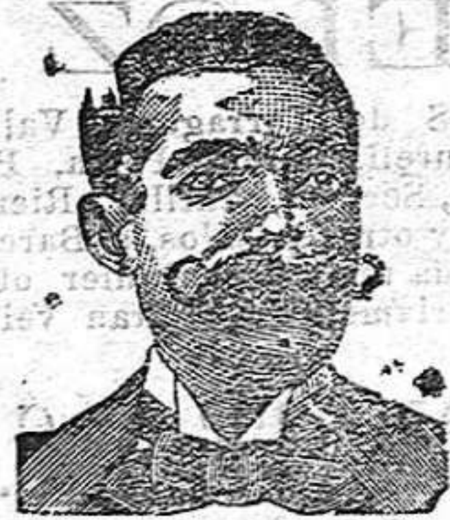
A. Salvati Costanzi Diputación, 435, Barcelona