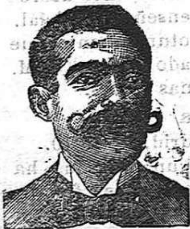
A. Salvati Costanzi Diputación, 435, Barcelona

Se reciben en la imprenta de este periódico hasta la una de la mañana.