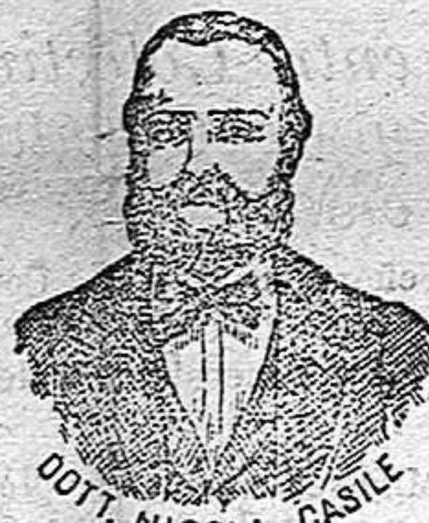
Inventor de los renombrados medicamentos CASILE. Diputación, 435 BARCELONA

han logrado que el Dr. Casile de Nápoles descubriera los milagrosos medicamentos que curan infaliblemente la tisis en cualquiera de sus períodos y todas las enfermedades del estómago.