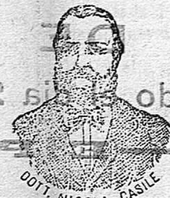
Inventor de los renombrados medicamentos CASILE. Diputación, 435 BARCELONA

han logrado que el Dr. Casile de Nápoles descubriera los milagrosos medicamentos que curan infaliblemente la tisis en cualquiera de sus periodos y todas las enfermedades del estómago. A la más pequeña manifestación de un resfriado, tos, catarro, bronquitis, gripe, asma (sufocación), espectoración y de cualquier enfermedad del pecho, tomar inmediatamente las PERLAS CASILE, que no sólo curan infaliblemente estas enfermedades, sino que se tendrá la completa seguridad de no contraer otras mucho más graves. Siguiendo este método se podrá decir no más tisis.