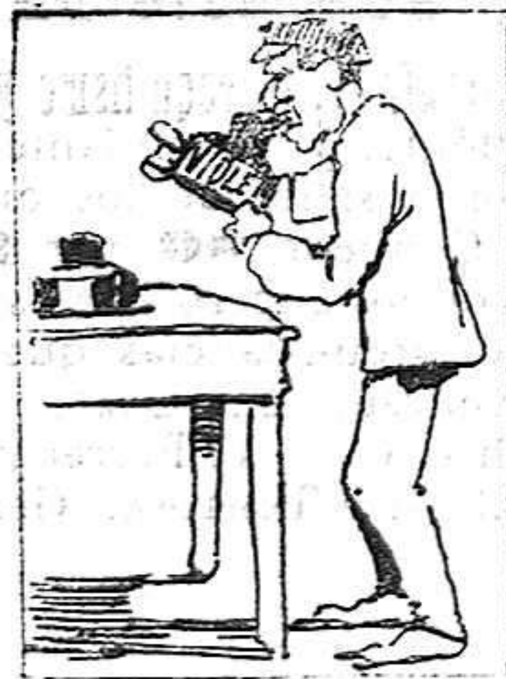
La solución en el próximo número.