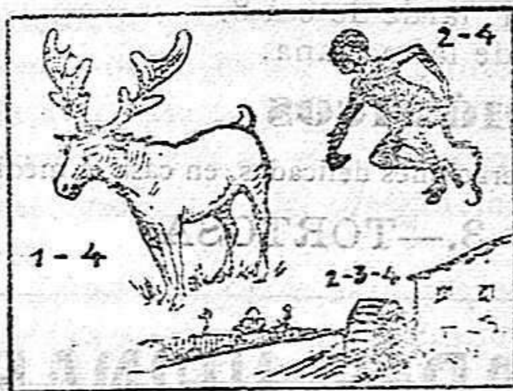
La solución en el próximo número.