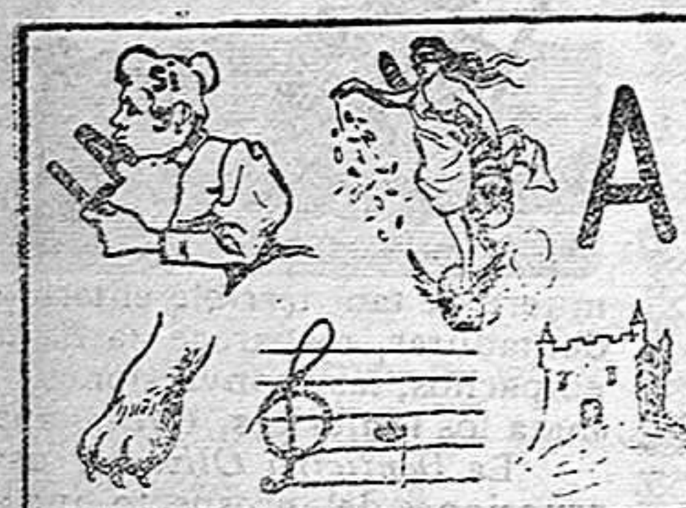
La solución en el próximo número.