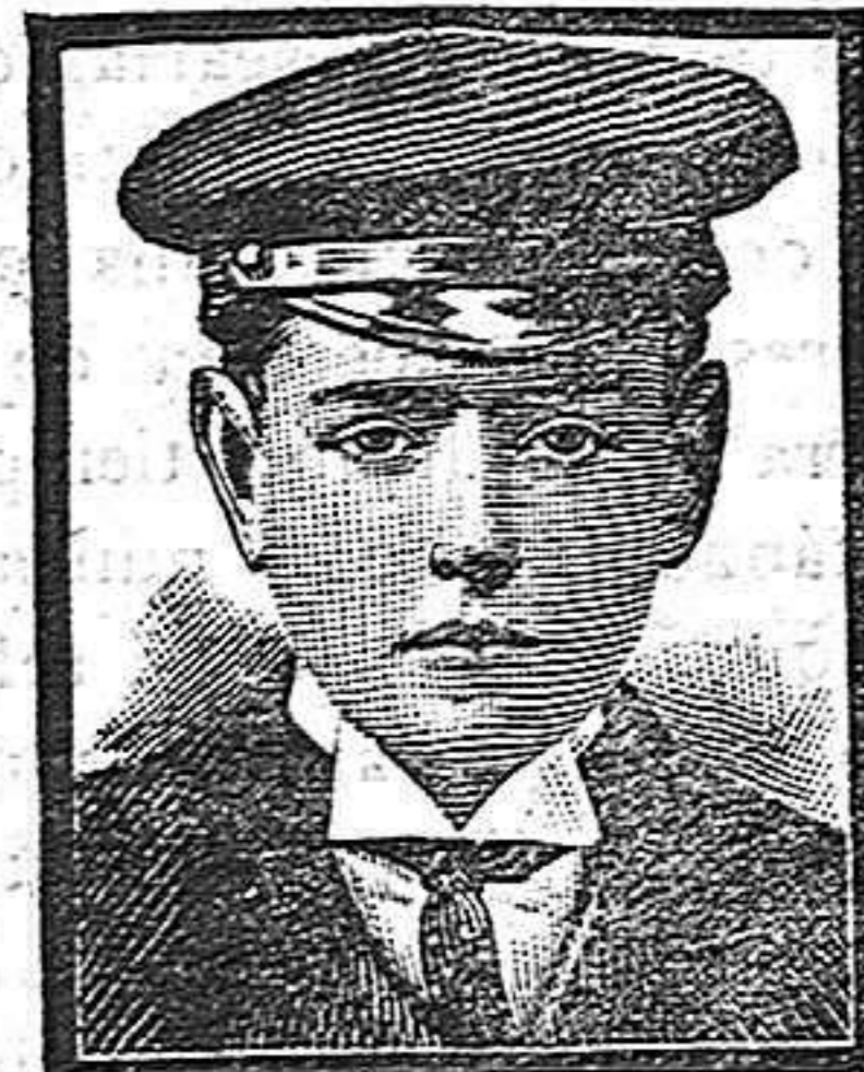
Barcelona, 11 Abril 1908. (Calle Conde Asalto nº 42.)

—Por la tarde, Exposición, á las cinco; Meditación, á las seis; Santo Rosario, á las seis y media; Reserva, á las siete.