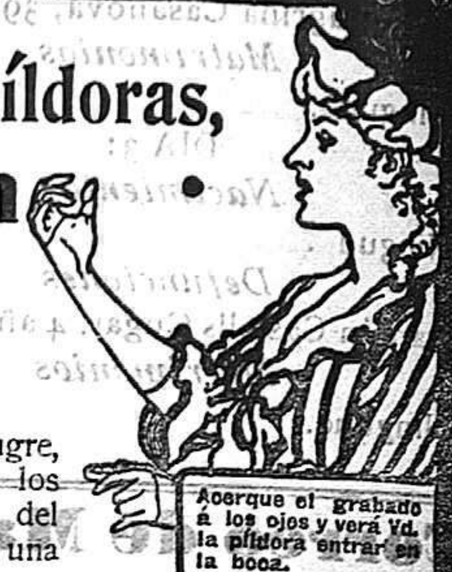
Asegure el grabado á los ojos y verá Vd. la píldora entrar en la boca.