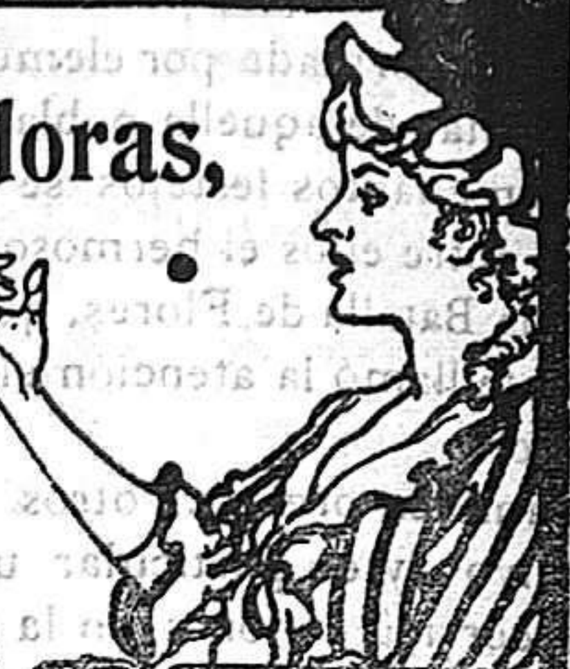
Asegure el grabado á los ojos y verá Vd. la píldora entrar en la boca.