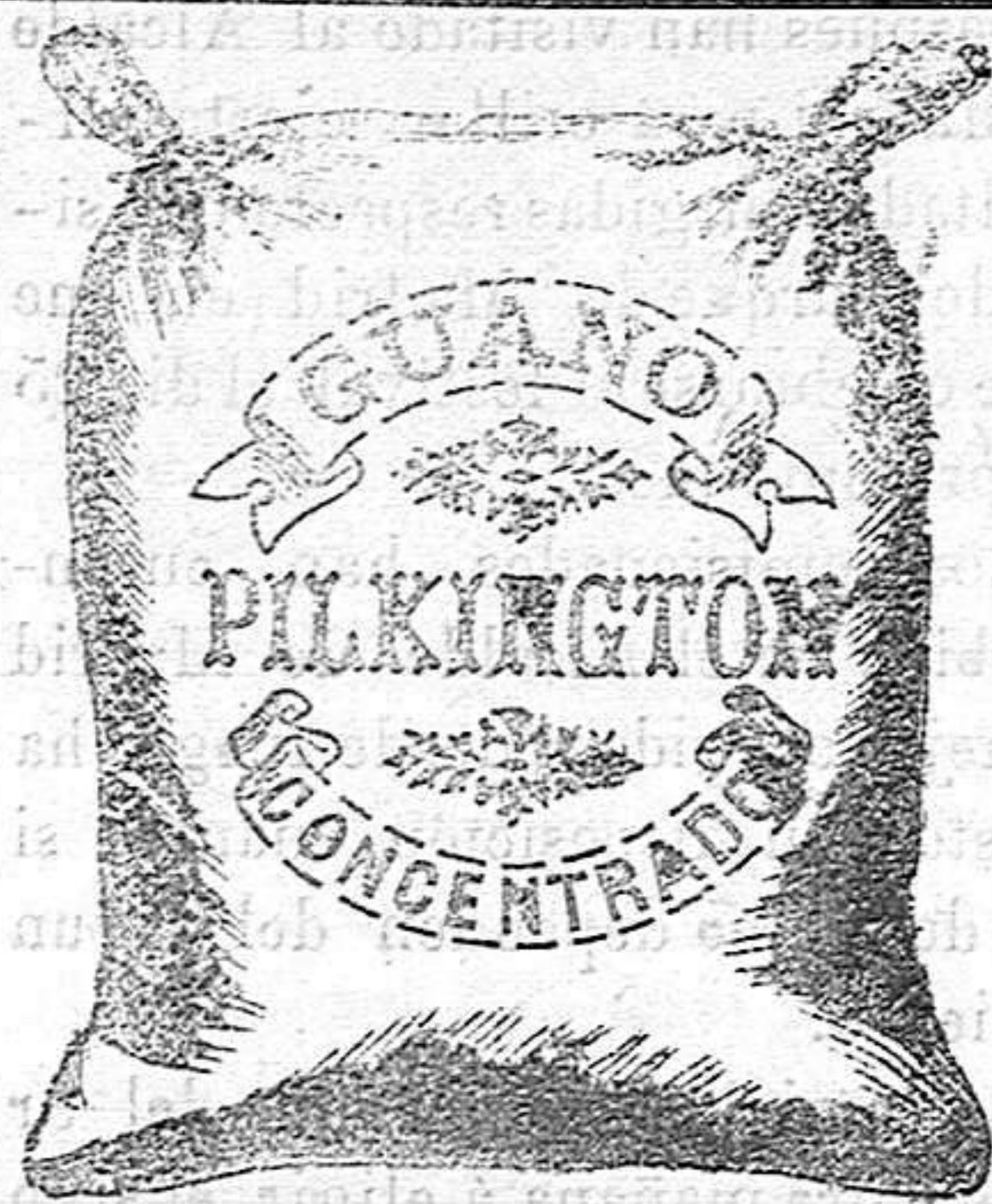
En las principales droguerías