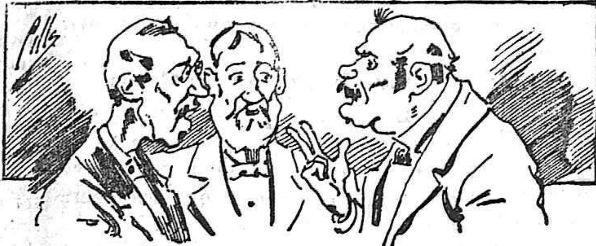
Abominan á nuestros libros....., pero los compran.

Todas las personas de gusto, curiosas e ilustradas deben pedir al Director de LA AVISPA, apartado núm. 8, MADRID, un ejemplar que se remite gratis y franqueado. Esta Revista Enciclopédica Popular publica recreaciones científicas, recetas de cocina, repostería, confitería, vinos, licores, pinturas, barnices, betunes y fórmulas para toda clase de industria, y cuantas noticias y conocimientos puedan ser beneficiosos. Cuenta además con buenos grabados, parte literaria excelente; da regalos mensuales á sus lectores con la Lotería Nacional y participaciones en la misma, á cuyo efecto compra todos los sorteos, y en una de las Administraciones más afortunadas por la suerte, billetes enteros. La suscripción y los números que se nos pidan se sirven gratuitamente á correo vuelto y franqueados, con sólo indicar el nombre y dirección del que lo desea en sobre dirigido al Sr. Administrador de