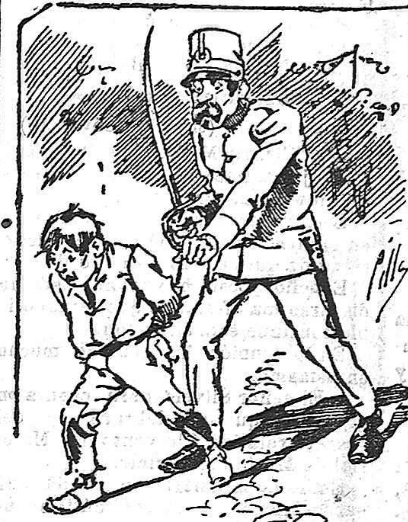
Tratamientos de la policía á nuestros vendedores cuando el número pica....